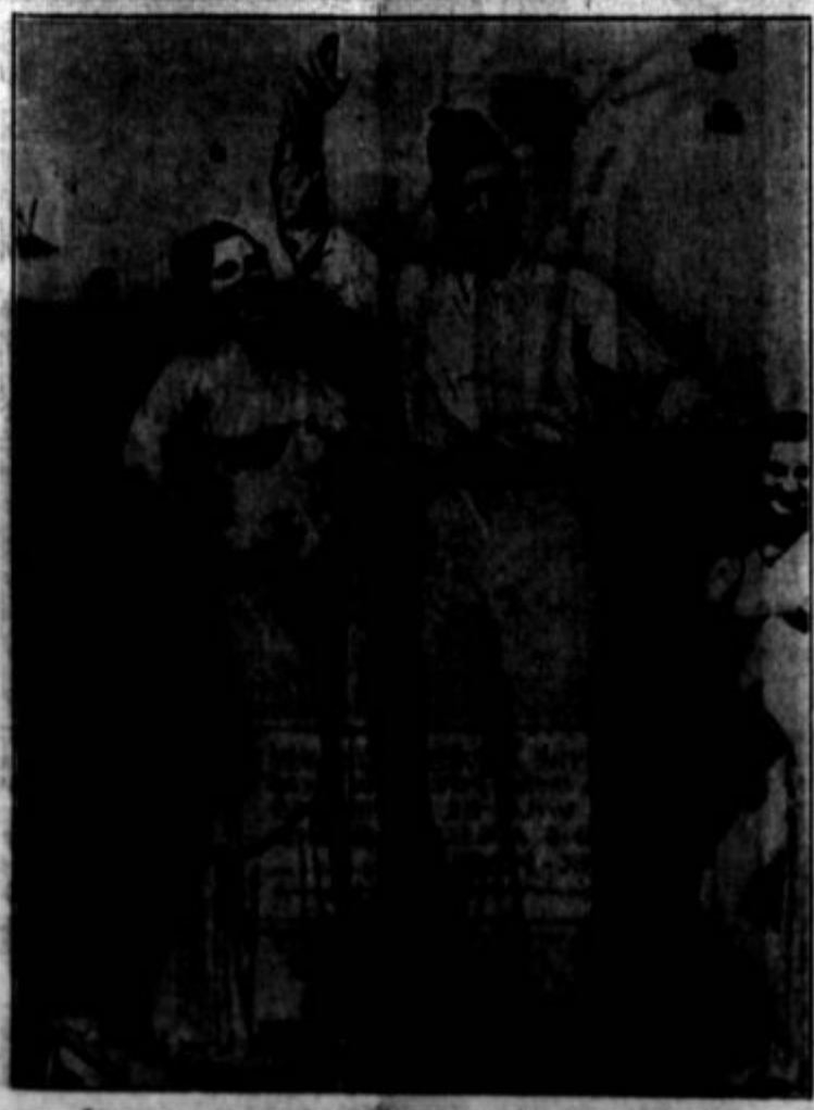
Čikaška razstava: Skupina iz "Malega Egipta".