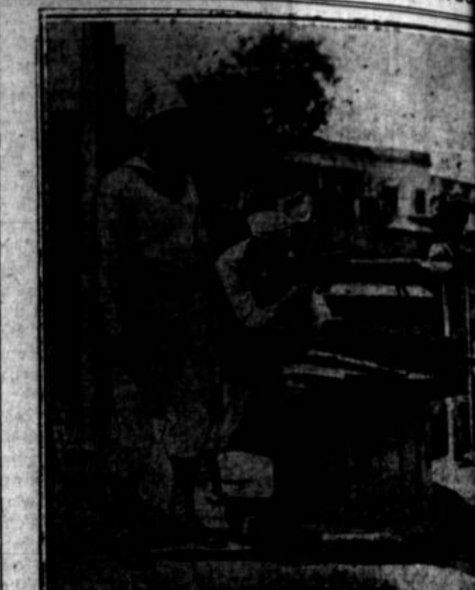
Revolucija na Kubi: Strojnice, ki jih je dal diktator postaviti okrog predsedniške palače v Havani, ga niso obkrožile, ko se je armada uprla.

Kaj je storil nemški PEN-klub proti izgonu znamenitih nemških profesorjev in učencev, proti izgonu Einsteina,