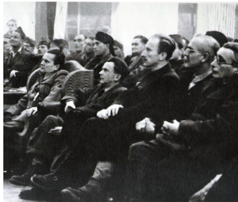
Drugo zasedanje Avnoja v Jajcu

ljen na popuščanje. Za sabo je imel travmatično, a po svoje zmagoslavno izkušnjo na Neretvi in Sutjeski, ki mu je dala samozavest, pa tudi prvo mednarodno priznanje in celo materialno pomoč Velike Britanije in ZDA. V tem okviru je Tito sklenil, da Moskve ne bo preventivno obveščal o sklepih, ki naj jih sprejme drugi AVNOJ, namreč o dokončnem prelomu s staro Jugoslavijo in oblikovanju nove, ki naj bi ji