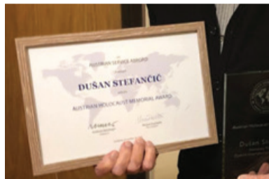
Avstrijsko priznanje našemu taboriščniku