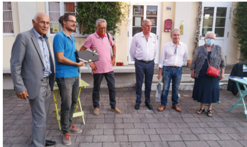
Govorniki ob odprtju razstave