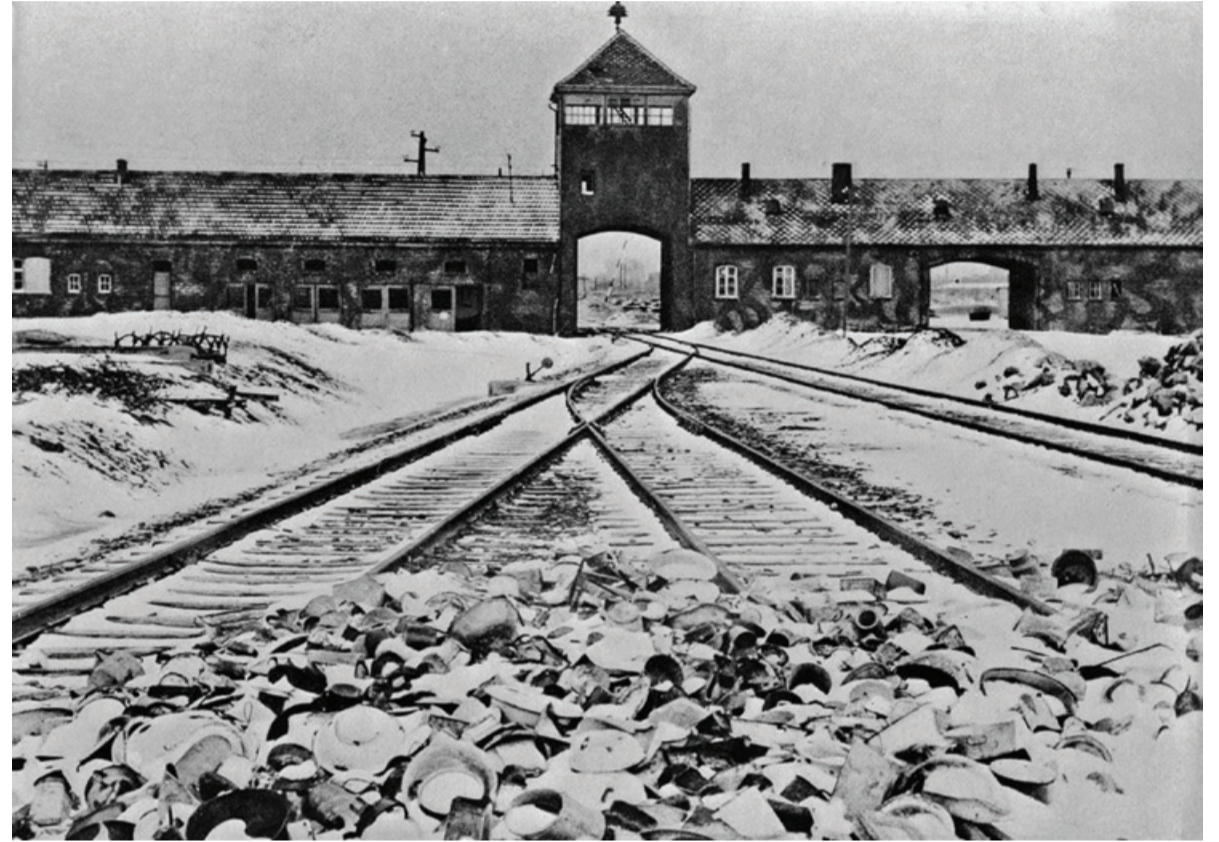
Auschwitz Birkenau takoj po osvoboditvi leta 1945

Takoj po razglasitvi rajha so se vzpostavila koncentracijska taborišča za vse »nevarne« (komuniste,