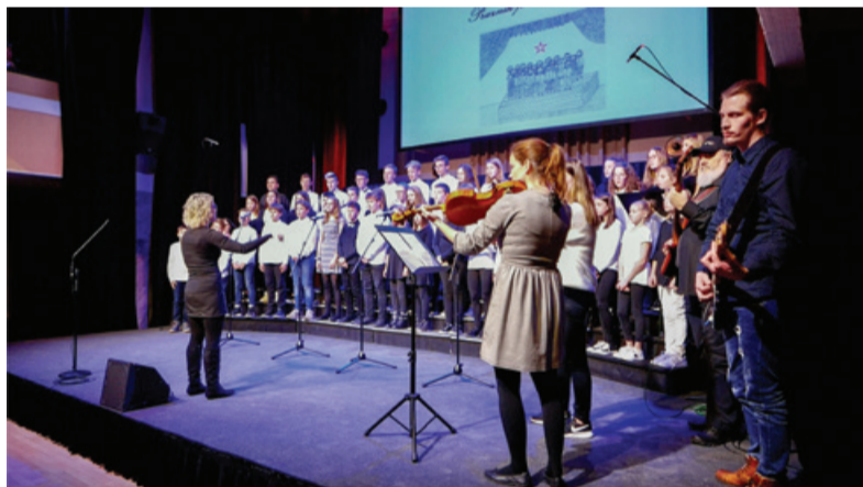
Otroški pevski zbor Osnovne šole Milana Šuštaršiča iz Ljubljane.

KUD Serafin je 28. novembra pripravil 12. praznik partizanske pesmi, tokrat ne v Festivalni dvorani, ampak v trenutnim razmeram prilagojeni obliki, na spletu. Spored so sodelujoči oblikovali s posnetki iz arhiva ali so jih dobili od posameznih zborov, en posnetek pa je nastal prav za to priložnost v produkciji KUD Serafin. Po vsej Evropi je partizanska pesem govorila o nadčloveškem boju malega naroda, ki je z odločnostjo svoje volje preživel in skupaj s svojimi zavezniki tudi zmagal. Partizanska pesem je bila glasnica slave, ponosa in dostojanstva našega človeka. In ta v boju prekaljeni Slovenec je danes