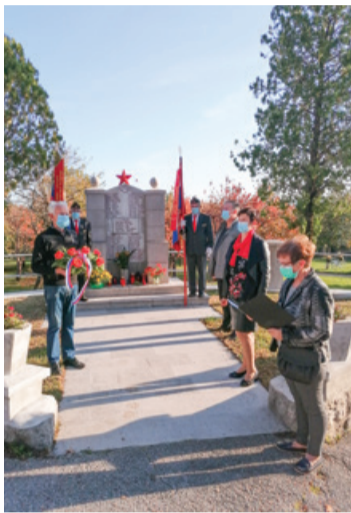
Spominska plošča na Osnovni šoli Žiri