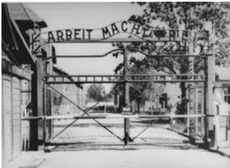
Vhod v taborišče Auschwitz v mestu Oświęcim

Zakaj je treba razkrivati vsestranske razsežnosti holokavsta in zakaj ga ne smemo pozabiti? Odgovor, ki ga je v knjigi Potopljeni in rešeni zapisal Primo Levi, ima v sedanosti še večjo težo kot v osemdesetih letih 20. stoletja: »Ni lahko, niti prijetno raziskovati tega brezna zlobe, vendar mislim, da je to treba storiti, kajti tisto, kar je bilo možno zagrešiti včeraj, bo lahko kdo spet poskusil jutri in bo morda zadevalo nas ali naše otroke.« Ta »jutri« se v posamičnih primerih že dogaja z razgrajevanjem demokratične ureditve, s krepitvijo avtokracije, s povečevanjem brezbriznosti najbolj odgovornih svetovnih voditeljev do neprekinjenih grozodejstev in nasilja nad večino ljudi po svetu in doma.