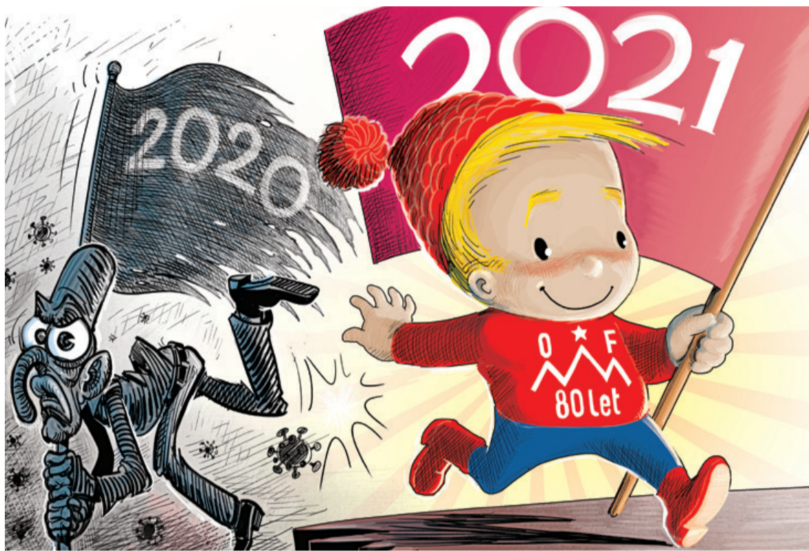
Prihodnje leto bo eden izmed osrednjih dogodkov ZZB NOB Slovenije počastitev 80. obletnice ustanovitve OF. Ilustracija: Ciril Horjak