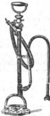
Podoba 13. Seitzeva brizgalna za snaženje azbestnih cedil in praznih sodov.

Če se pa s precejanjem preneha, je treba mreže z vodo dobro oprati, najbolje z vodnim curkom vodovoda, da ne ostane na njih nič azbesta. Kjer tega ni, se priporoča za veliko cedilo nabava v pod. 13. naslikane iz-