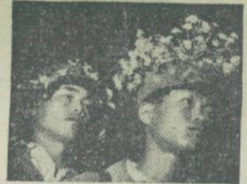
Fotoreportaža s Koreje