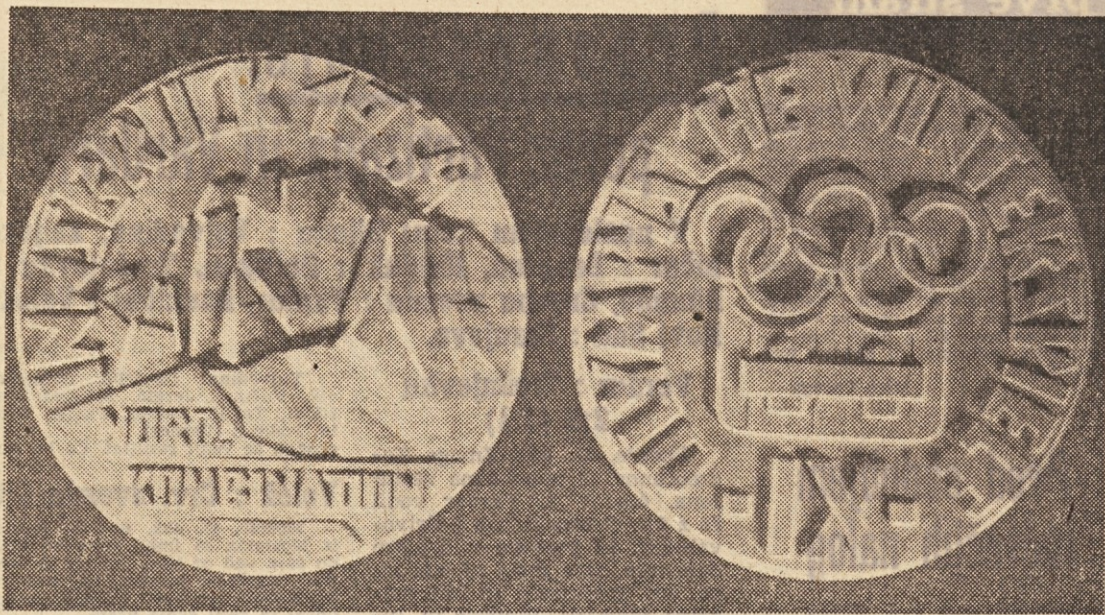
Za najboljše so že pripravili olimpijske medalje

Zimske olimpijske igre na televizijskem zaslonu – Pričakujejo 1800 udeležencev – Tudi zimske olimpijske igre bodo imele svoje predigre – Vprašanje nastanitve ni več pereče – Evrovizija bo prenašala izredno veliko število posameznih tekmovalcev