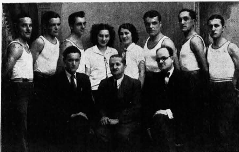
Prednjački tečaj Sok. društva Bela Crkva, održan od 14-XII 1937 do 11-II 1938