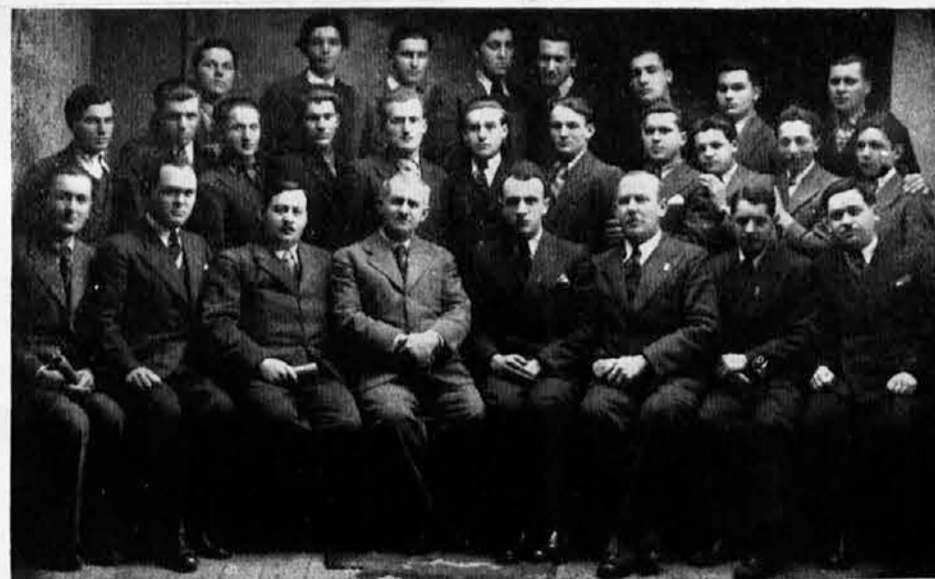
Prednjački tečaj Sok. društva Čurug, održan od 31-I do 12-II o. g.