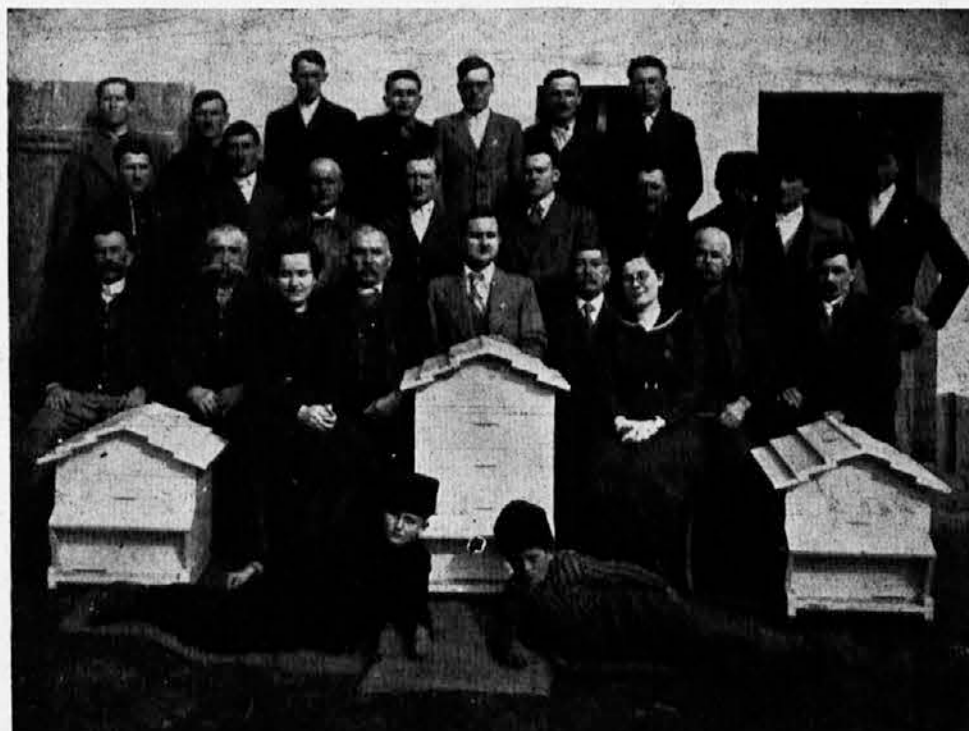
Pčelarski tečaj Sok. društva Mokrin

gorija i u kome će se izvoditi obavezno fizičko vaspitanje.