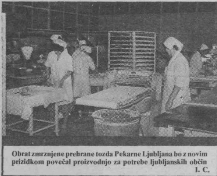
Obrat zmrznjene prehrane tozda Pekarne Ljubljana bo z novim prizidkom povečal proizvodnjo za potrebe ljubljanskih občin I. C.