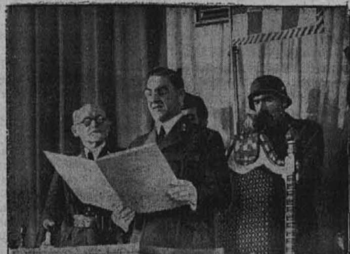
Poglavnik je otvoril hrvatski sabor

Führer je sprejel Generalobersta Modela. V svojem glavnem stanu povedom njegovega imenovanja. Generaloberst Model je tukaj od Führerja osebno prevzel svoje povišanje. — V ozadju stoji Generalfeldmarschall Keitel.