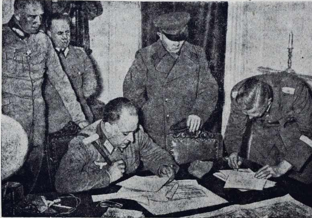
Ruski i nemški častnici v pogovori od vojaških namenov.

Hitler je po radii ponúdo mir Angliji, šteroga naj sklne z Nemćijov i Rusijov potom, ka Polске, nega več. Da će ga ne sklne, de ona kriva krvnoga prelejanja.