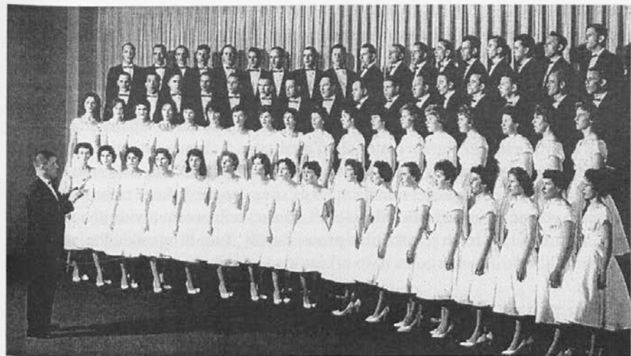
Pevski zbor Korotan ob desetletnici - jeseni 1961

Jasno mi je bilo dvoje: 1. da mora biti skladba napisana v slogu, ki ga bo zbor zmogel naštudirati v odmerjenem kratkem času; in 2. da naj skladba predstavi nekaj pomembnega za naše poslušalce in za tako pomembno obletnico zbora. Moral sem slediti predvsem praktičnim smerem, ne svojim kompozicijskim hotenjem.