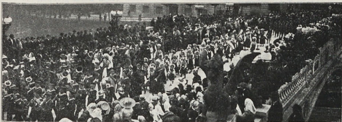
Slovensko-hrvatski katoliški shod v Ljubljani 1. 1913: Sprevod na jubilejnim mostu.