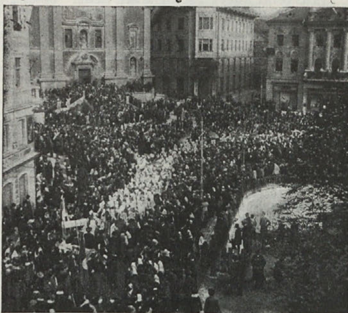
Slovensko-hrvatski katol. shod Ljubljani 1. 1913: Pohod čez Marijin trg.

Francoska duhovščina, ki je morala v vojni več pretrpeti kakor duhovščina katerekoli države in brez ozira na ogromno moralno