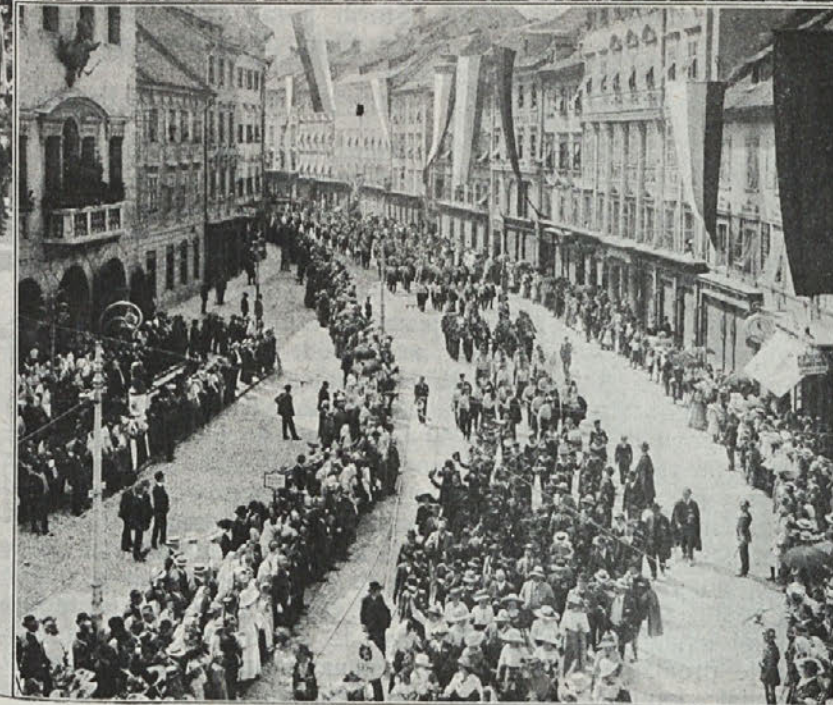
Slovensko-hrvatski katoliški shod v Ljubljani l. 1913; Zbiranje sv. maše na Kongresnem trgu. Pohod mimo mestne hiše.