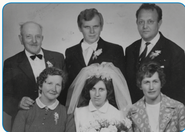
STARIŠKE SO SE ZGLIJALI, MI SMO SE ŽENILI stran 8