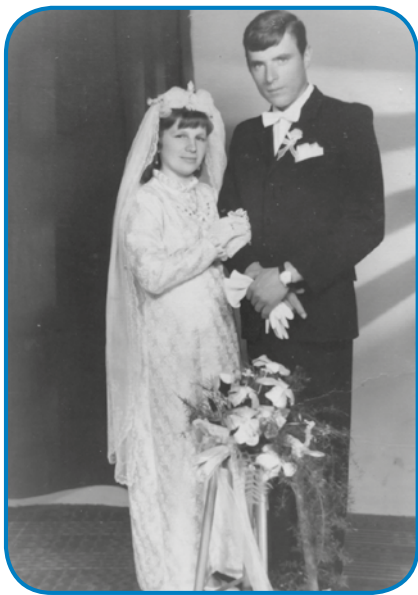
Z možaum sta se zdala 1971. leta

bilau, po meši smo k njej šli na obed. Müve s sestrov sva nagnauk bile na potrdjavanji, zavolo tau-ga je z menov oča üšo na obed,