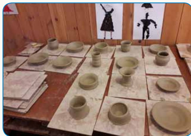
SKUPNI ŠOLSKI DAN stran 6