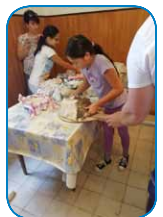
Števanovski učenci so pekli kruh na Seniku

Na koncu so še lahko igrali nogomet na šolskem igrišču.