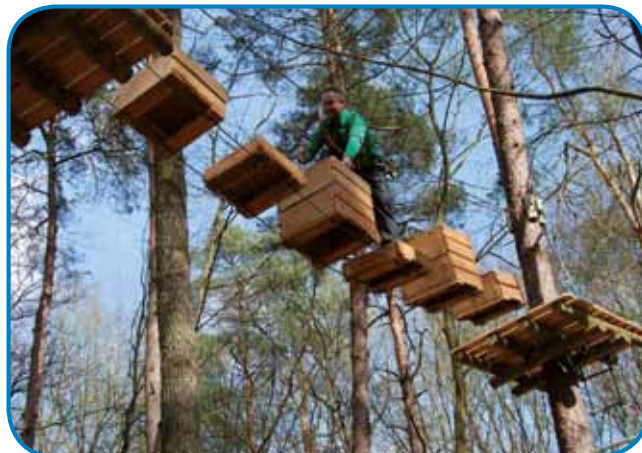
Pustolovski park je napravljeni v lesi pri Bukovniškon jezeri

zidanico, stera ma ime Martinova klejt, prenaüvili, tak ka jo zdaj vödavamo tüdi turistom. V apartmaji je mesto, ka leko v njem prespi devet lüdi. No in za naše goste mi pripravlamo tüdi degustacije vina. Avstrijci ali Nenci pousüjoga sploj neškejo