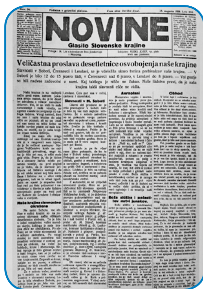
Tekst je dopolnjen s številnimi faksimili različnih ohranjenih dokumentov

na dejavnost evangeličanskih duhovnikov in učiteljev je tako rodila etnično zavedanje prekmurskih Slovencev, narodno zavednost pa so v vlogi narodnih buditeljev podkrepili za tem še katoliški duhovniki, tako s tiskimi, pri čemer gre v