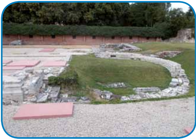
Ostanki Marijine Bazilike v Székesfehérvári - v njej so kronali največ vogrski kralov, petnajset od nji so tam dali na večni pokoj

drás ino Béla so mogli zbejžati z rosaga, depa Gizella se je tö nej preveč razmila s Petrom Orseolom, šteri je želo na mesto njenoga siná staupiti. Vse tau je gvüšno pomagalo pri tom, ka je že betežen krau Števan 15. au-