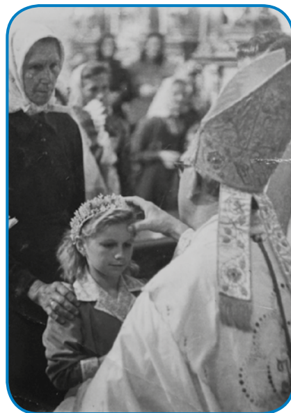
Pri potrdjavanji (birmi)

sem dosta pojbov mejla, dapa mati je telko lejtala na atija, ka ga je naratala pa je nutraprivolo. Potejm sem te dja tö mogla nutraprivoliti, ovak bi se dja z njim nikdar nej ženila.