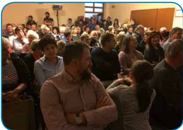
Nabito polna dvorana seniškega kulturnega doma

»Moj prvi stik s Porabjem in to, kako sem te kraje doživel in te ljudi spoznal, je v veliki meri vplivalo na to, da sem se odločil za tukajšnje snemanje. Ob tej priložnosti bi se rad srčno zahvalil vsem ljudem, ki so pomagali pri