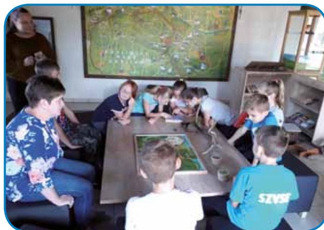
Seniški učenci so se v Števanovcih spoznavali s favno in floro Porabja

Na začetku oktobra smo imeli skupni šolski dopoldan z učenci seniške šole. 4. in 5. razred sta se odpeljala na Gornji Senik v Kūharjevo spominsko hišo, kjer so pekli kruh. Ob tem so še imeli delavnico, v kateri so si lahko naredili cvetlice iz krep pa-