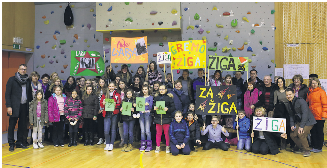
Projekt Otroci pojejo slovenske pesmi in se veselijo ima potencial, da postane vseslovenski, kar se kaže tudi v dogovoru z nacionalno televizijo, ki bo posnela letošnji finalni dogodek. »Ob tem smo vzpostavili že tudi kontakte z zamejskimi osnovnimi šolami, zato lahko naslednje leto pričakujemo, da bomo slišali petje slovenskih pesmi tudi iz obmejnih območij Hrvaške, Madžarske, Avstrije in Italije,« dodaja Slameršak.

Ptuj, Podravje • Odprtje nove enote Zasebnega vrtca Vilinski gaj