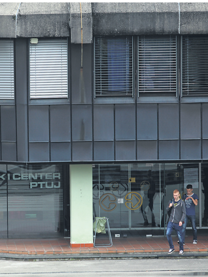
pod odkriljem ŠC znašle v finančnih stiski, je več: upad števila dijakov, napredovanja učiteljev v plačnih razredih.

težav nakazovalo dodatna sredstva. Med njimi sta tudi Gimnazija Ptuj in Šolski center Ptuj. Razlogov za to, da s strukture zaposlenih in napredovanja učiteljev v plačnih razredih. Kadrovska struktura ŠC Ptuj precej odstopa od razreda nad priznanim.