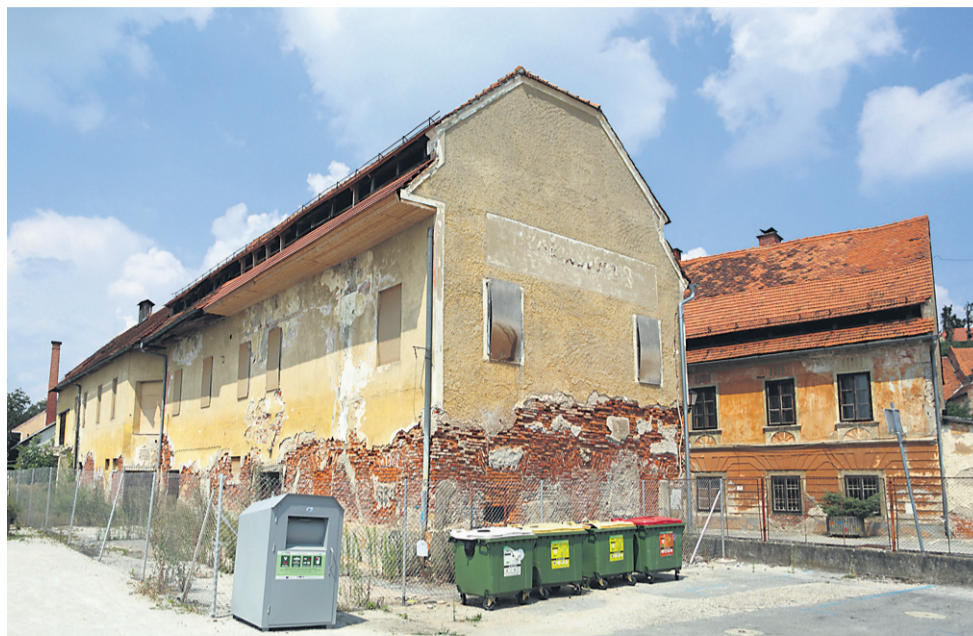
Letos spomladi so na ptujski občini naredili popis prostorov v občinski lasti. Našteli so okoli 10.000 kvadratnih metrov praznih prostorov, v to vsoto pa stanovanja niso vključena ...