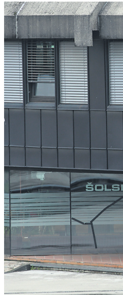
Razlogov za to, da so se srednje šole dvig starostne strukture zaposlenih in

Na vprašanje, ali je morda razlog vseh težav tudi v tem, da je na obeh ptujskih zavodih preveč zaposlenih, so na MIZŠ