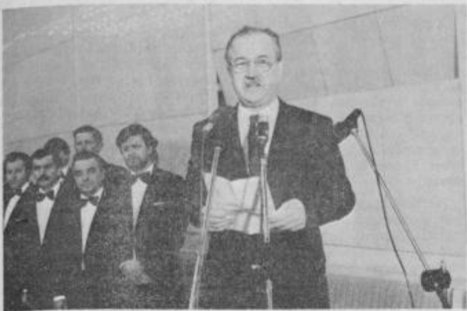
Razstavo v Ljubljani je odprl Janez Zemljarič — podpredsednik Zveznega izvršnega sveta.