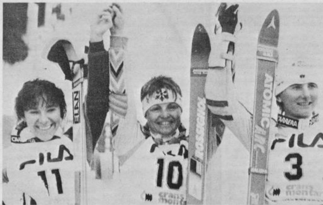
Mateja Svet (levo), Erika Hess in Roswita Steiner, tri najboljšje svetovne slalomistke Crans Montane 87.

svojo odlično formo. Med tistimi, ki so predzadnji in zadnji dan svetovnega prvenstva bodrili naše fante in dekleta, smo bili tudi tokrat Ptujčani, atrakcija zase pa so bili naši kurenti, ki so pritegnili veliko pozornost. — OM