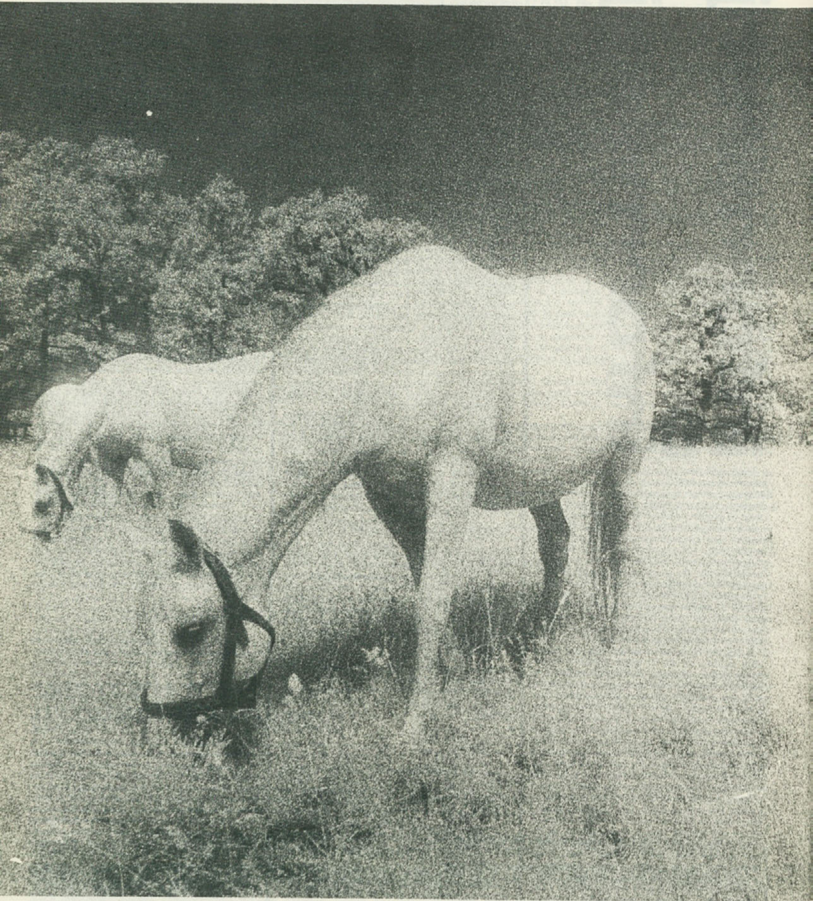
Prijateljem iz KUD „ŠTUDENT“ ob praznovanju petnajste obletnice plodnega dela čestita uredništvo