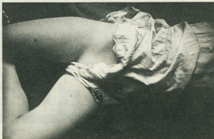
Tistim, ki so naslovnico v prejšnji številki zamenjali, da bi videli še sprednjo stran, in tistim, ki jim naslovnica ni bila všeč, uredništvo s spoštovanjem poklanja »ta sprednjo« iste ženske.

Na koncu bi vas samo še opozorili na dva teksta, ki govorita o skoraj isti problematiki: Informiranje o informiranju in Preosnova Katedre.