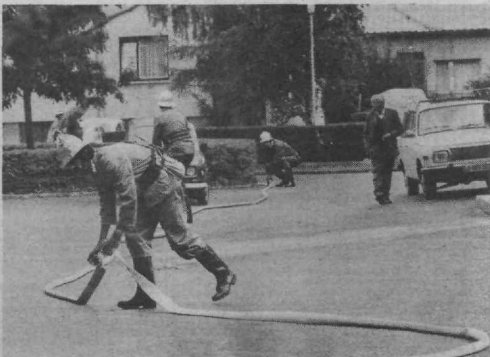
«Mini vaja», kot so jo imenovali krajanje Brinja je potekala kratko, hitro in učinkovito. Gasilci Ljubljanskih mlekar so se izkazali kot odlično izurjeni in organizirani.