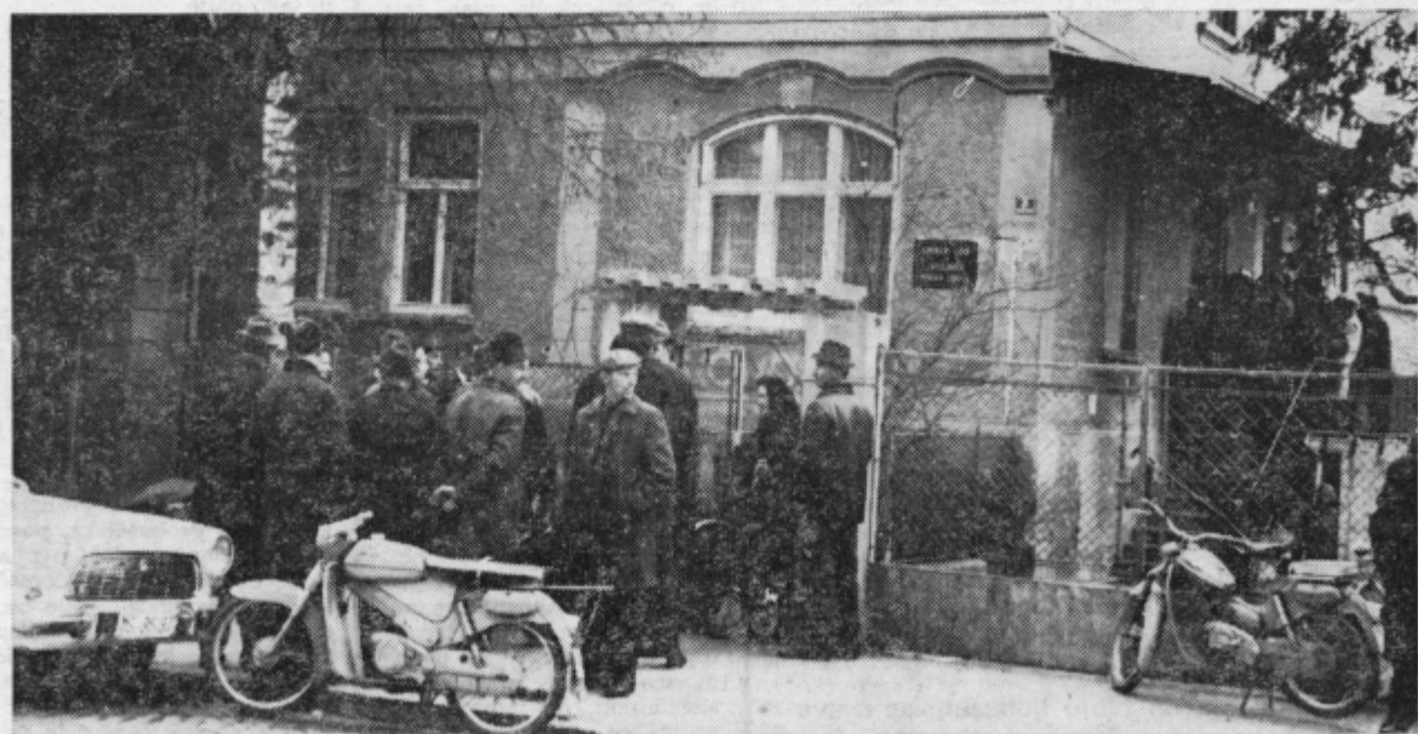
Pred komunalnim zavodom za zaposlovanje v Murski Soboti. Od tu naprej vodijo organizirane poti na delo v tujino, nihče pa nima pregleda, kam vse se stekajo s tem delom prislužene devize...