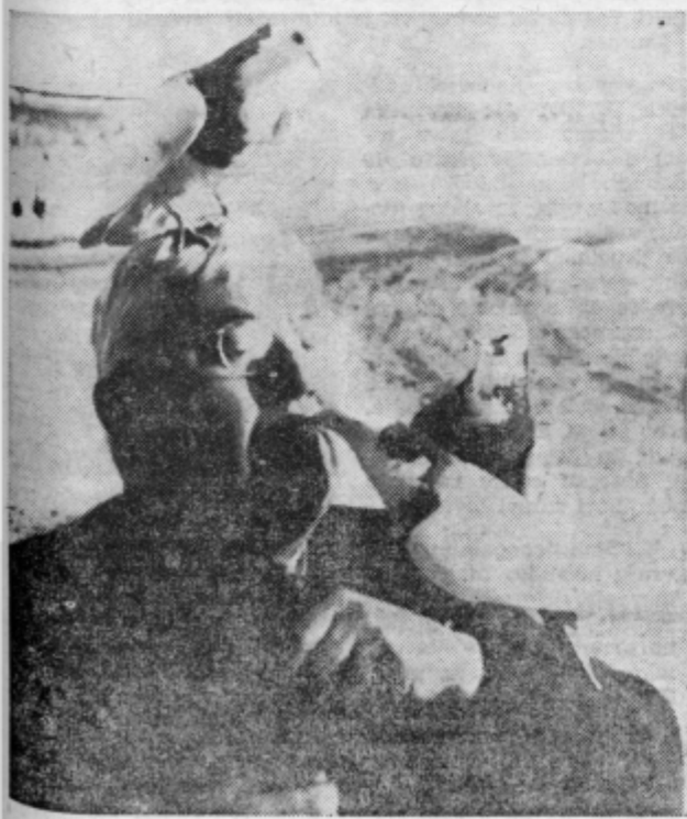
»Pred hišico na klop« sedi »dolobi svojimi govori...«