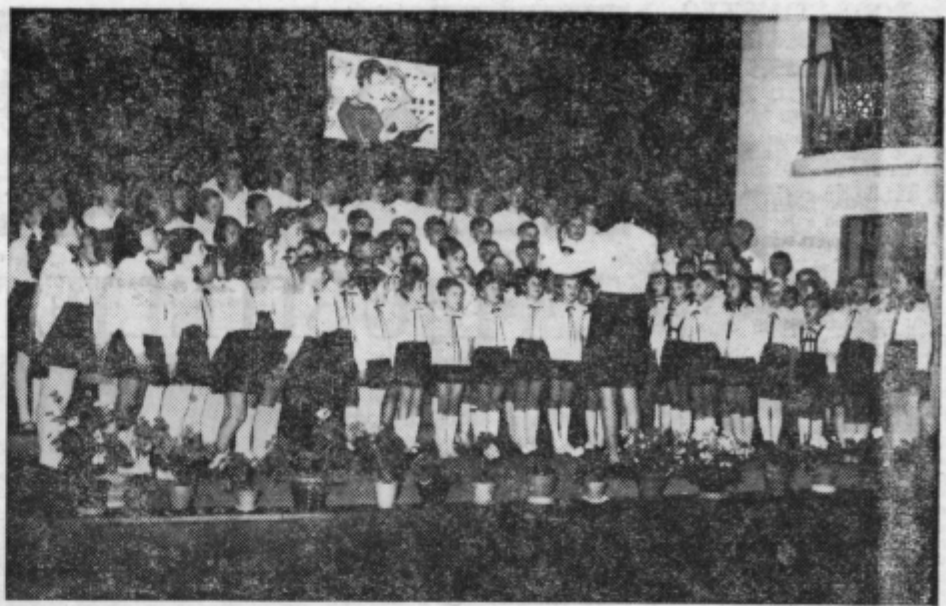
PIONIRSKA PEVSKA REVIVA V STORAH