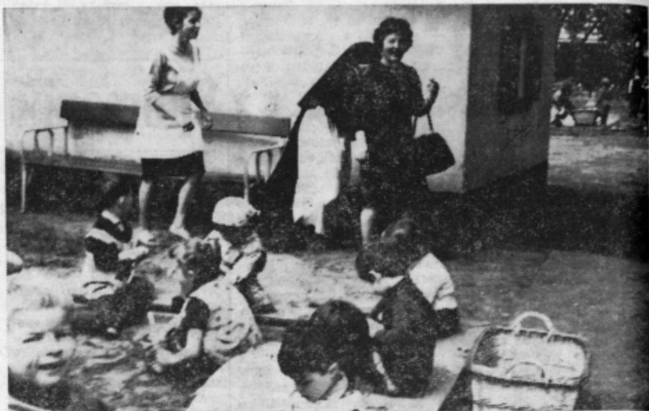
Otroci so zatopljeni v igro; med njimi bi prepoznali obraze otrok pomurskih delavcev, seveda daleč od doma, v peskovniku samostanskega zavetišča pri Leobnu...

Starejši so nam privzgojili lepo navado, da znanca ali prijatelja ob srečanju najprej povprašamo po ljubem zdravju, službi, plači... Zadnji čas pa se znanci in prijatelji, ki prihajajo semkaj, bolj kot za zdravje zanimajo, kako je s šilingi, po čem so marke, forinti. Vsem seveda ni do avtomobilov; mnogi bi si radi privoščili cenejše potovanje v tujino ali kupili kak stroj in podobno. Tu jim »borza« hvaležno priskoči na pomoč. Tako imajo na voljo šilinge, marke, da o forintih ne govorimo, saj jih v banki odkupijo le za svoje »šalterske« potrebe. Te pa niso posebno velike, zato nič nenavadnega, če ljudje po gostilnah ali kar sredi ulice trgujejo s tujim denarjem. Tu ne odloča uradni tečaj, ampak stari, neizprosni zakon ponudbe in