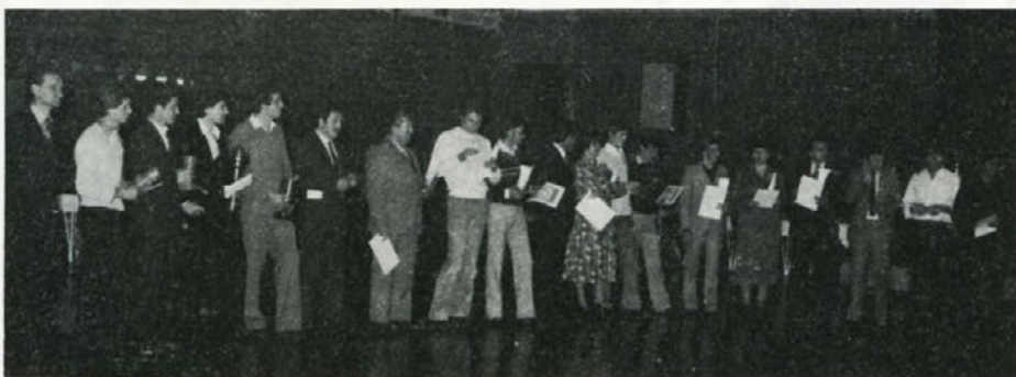
Predstavniki najbolj organiziranih OZD v rekreaciji