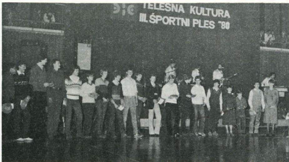
Najboljši športniki v letu 1980

Po končani razglasitvi in podelitvi pokalov in nagrad nas je zabaval ansambel VENUS in naš humorist Poldek, ples pa sta otvorila najboljša športnika Celja. Ob prijetnem razpoloženju se je ples zavlekel do zgodnjih jutranjih ur in nekaterim je kar prav prišla generalka pred silvestrovanjem.