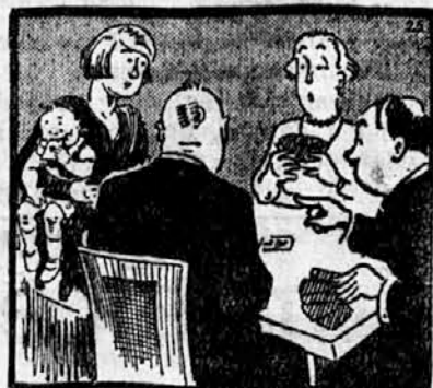
»Zakaj nisi dala asa?« »Kako. če ga na ima Pepček v ustih!«

Pred neko kavarno v Monte Carlu stoji avto, lepa limuzina. Pristopi gospod z angleško sportno čepico, in drži v roki pismo. Poda pismo šoferju in pravi dostojanstveno: »Prosim, ponosite tole pismo vašemu gospodu!« Šofer vzame pismo, gre v kavarno in ga izroči svojemu gospodu. Ta ga odpre in na svoje začudenje bere to-le: »Če bo šlo, je dobro, — če ne bo šlo, je tudi dobro.« Kaj naj pa to pomeni? vpraša gospod in pokaže pismo šoferju. Ta ga prebere, premišljuje nekaj časa, nato pa plane ven, pogleda na cesto in pride — počasi nazaj. »Je šlo«, pravi ravnodušno svojemu gospodu. »Naš avtomobil je izginil.«