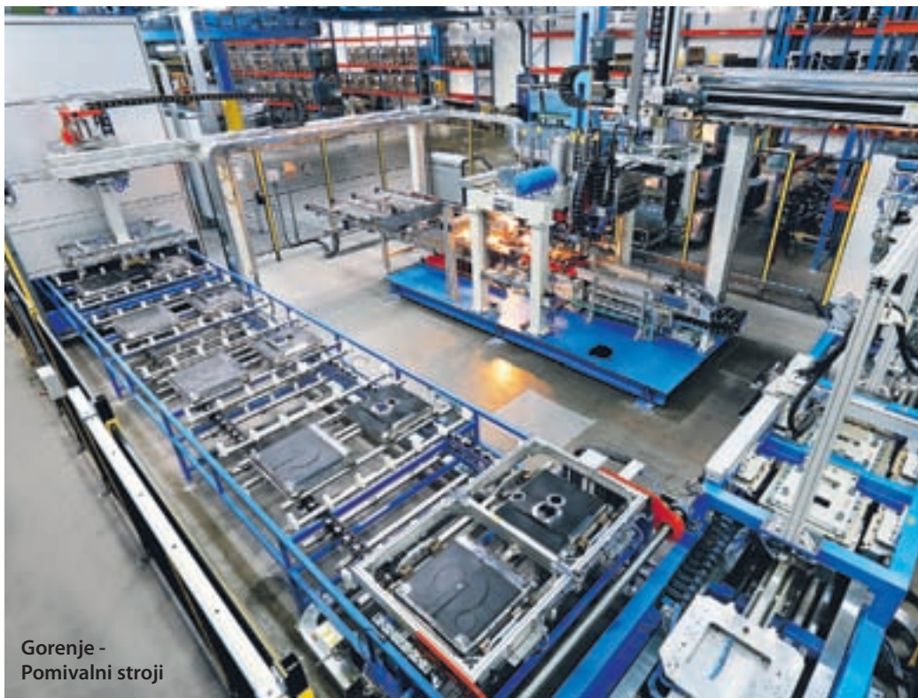
Gorenje - Pomivalni stroji

Izkazani prihodki so se v primerjavi z letom 2014 zmanjšali za 12,4 %, odhodki pa povečali za 11,5 %. Čisti dobiček se je zmanjšal za 4,6 %, čista izguba pa se je povečala kar za 287,7