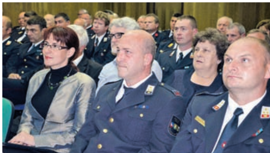
Na slavnostni seji ob 70-letnici PGD Pesje so obudili spomin na zgodovino in se zahvalili zaslužnim članom in članicam društva. Veseli so bili, ker je z njimi praznovala tudi ministrica za obrambo Andreja Katič.

na jubilejna priznanja, veseli pa so bili, ker si je zanje vzela čas njihova resorna ministrica. Ta je poudarila, da ceni njihovo delo, sploh, ker temelji na prostovoljstvu in ker so najmočnejši steber sil zaščite in reševanja v državi. Nam je povedala: »Če le imam čas, se zato rada odzovem takim vabilom. Še posebej hvaležna sem gasilcem iz Šaleške doline, ki so mi v preteklih letih dodobra predstavili