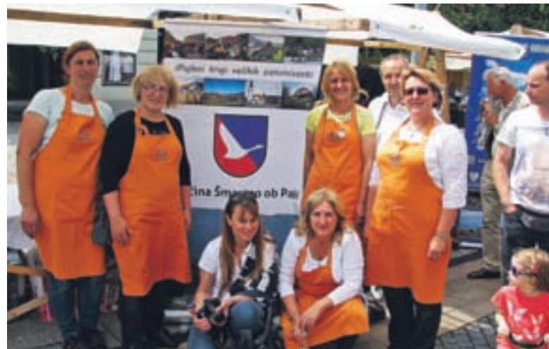
»Ekipa«, ki je sodelovala na festivalu sv. Martina na Madžarskem.

ške, Romunije do Slovaške. Letos so se na festivalu prvič predstavili tudi Občina Šmartno ob Paki, tamkajšnji javni zavod Mladinski center ter šmarško turistično društvo.