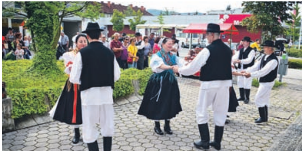
Prikaz međimurskega ljudskega in cerkvenega praznika je bil kulturno in kulinarično bogat.

Letno v međimurskem društvu Velenje pripravijo kar 24