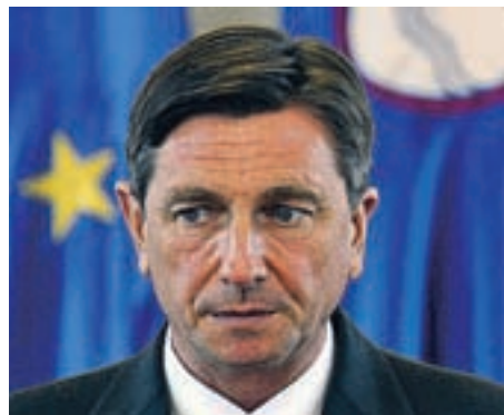
Srbsko zunanje ministrstvo je našemu veleposlaniku izročilo protestno noto ob izjavah predsednika Pahorja.

Srbsko zunanje ministrstvo je slovenskemu veleposlaniku v Beogradu izročilo protestno noto zaradi nedavne izjave predsednika Pahorja, ki je pozval k popolnemu priznanju neodvisnosti Kosova.