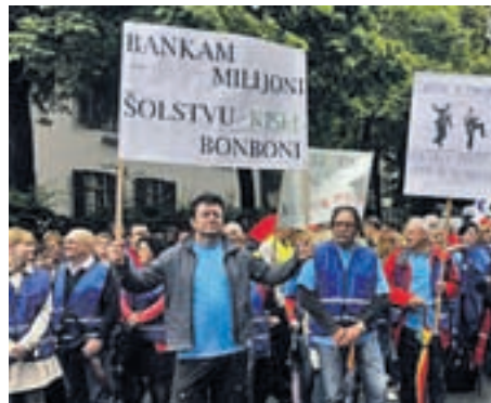
Po protestnem shodu se je premier sešel z vodji pogajalskih skupin sindikatov.

Predsednik vlade se je po protestnem shodu sindikatov javnega sektorja sešel z vodji pogajalskih skupin sindikatov, srečanja pa se