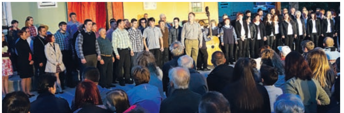
V zabavni burki izpod peresa Johana Nepomuka Nestroya, ki je osvojila domala vse odre po Sloveniji, po Evropi in marsikje po svetu, je nastopilo blizu 120 kulturnih ustvarjalcev tukajšnjega okolja.

ga največ entuziazma, ljubezni, energije, veselja in dobre volje. Vsem nastopajočim in sodelujočim zato globoko spoštovanje in velik aplavz za naprej.«