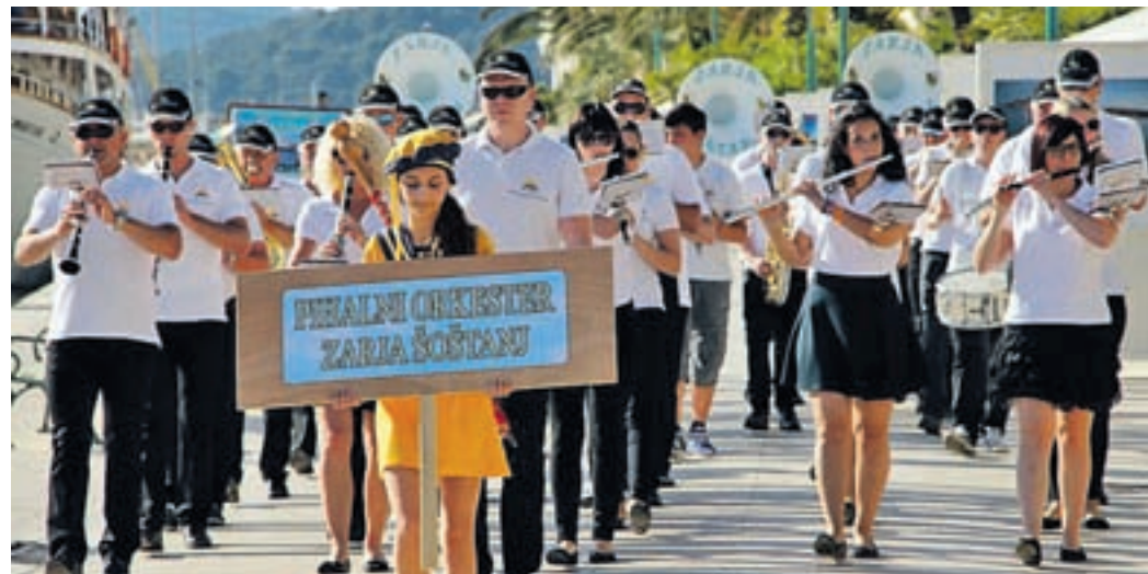
Festival se začne s povorko godb po ulicah Malega Lošinja.

Članice in člani PO Zarja iz Šoštanja smo se že četrto leto zapored udeležili Mednarodnega festivala pihalnih orkestrrov na Malem Lošinju. Na festivalu je sodelovalo enajst orkestrrov z več kot 500 godbeniki iz Slove-