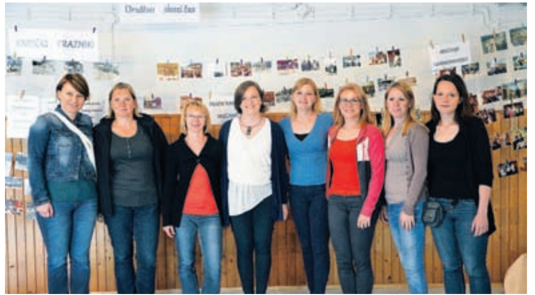
Avtorice spominske razstave ob 40-letnici Kulturnega društva Plešivec so ob pripravljanju razstave obudile številne spomine. To velja tudi za obiskovalce razstave, ki so si jo ogledali po kratkem kulturnem programu na športnem igrišču pod šolo.