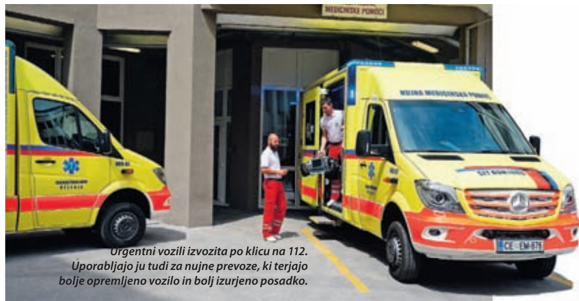
Urgentni vozili izvozita po klicu na 112. Uporabljajo ju tudi za nujne prevoze, ki terjajo boljše opremljeno vozilo in bolj izurjeno posadko.

mo,« pravi. Doda, da se mu zato kritika, češ da vozilo zaradi velikosti ne more v garažno hišo, zdi nepoštena. »Pravzaprav me je kar malo užalila. Izobraževal sem se v Celju in Mariboru, kjer imajo na urgenci podobna vozila. Tudi pri njih ne pridejo v parkirno hišo. Podobno kot še kje, kjer delajo po istih standardih.« Kaj pa, če je cesta ozka? »Če