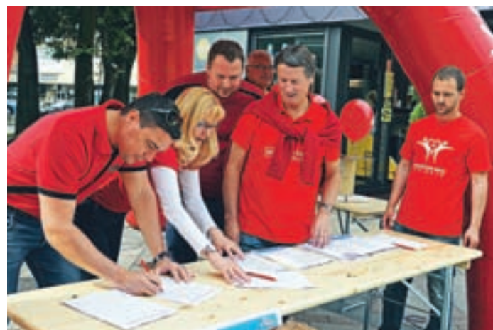
Prvi so se pod pobudo za ohranitev javnega šolstva podpisali velenjski Socialni demokrati.

ki prihajajo iz socialno šibkejših družin, pa ne. To pomeni, da bodo tudi zato ujeti v krog revščine in socialne izključenosti. Mislim, da Sloveniji na to ni treba pristati. Če smo v 20. stoletju dosegli enakost do stopnje izobrazbe, enakost spolov in standard delavskih in socialnih pravic, ni napredek, če se temu v 21. stoletju odrečemo. Socialni demokrati zbirajo podpise po vsej državi. Kot nam je povedal Škoberne, verjamejo, da jih bo