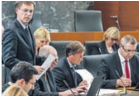
Premier pravi, da se bo vlada ukvarjala s pokojninami, zdravstvom, dolgotrajno oskrbo in davki.

V Konfederaciji sindikatov javnega sektorja so trditve ministra Koprivnikarja po sestan-