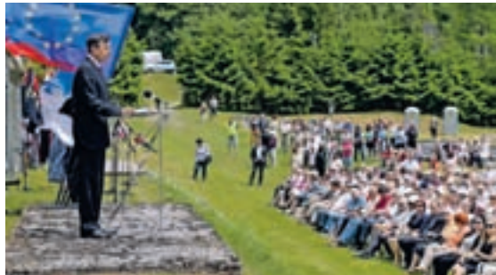
Pod Ljubljem so se spomnili obletnice osvoboditve podružnice koncentracijskega taborišča Mauthausen.

Predsednik Pahor se je ob počastitvi 25. obletnice prisega prve generacije slovenskih nabornikov ozrl na proces osamosvajanja in njegovo lepoto prepoznal v tem, da je ljudi vključeval in ne izključeval.