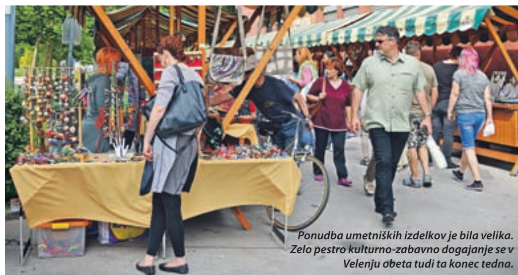
Ponudba umetniških izdelkov je bila velika. Zelo pestro kulturno-zabavno dogajanje se v Velenju obeta tudi ta konec tedna.

Velenje, 11. junija - V soboto dopoldne je v centru mesta kar vrvelo od dogodkov in obiskovalcev. Velenje je ponujalo podoben zanimivega mesta, zagotovo pa je k temu veliko prispeval tudi tradicionalni BazArt, ki je lepo dopolnjeval ponudbo rednega mesečnega boljšega sejma na Cankarjevi. Festival Velenje je za tokratno umetniško razstavno-prodajno tržnico privabil toliko razstavljalcev, da so napolnili 30 stojnic ob pešpoti med Cankarjevo in osrednjim mestnim trgom. Na njih se je predstavljalo kar nekaj domačinov, pa tudi umetniki in umetnice iz drugih delov Slovenije. Njihovi izdelki so bili raznoliki, že sprehod med stojnicami je bil doživetje. Obiskovalci so si lahko, če so želeli, glavo okrasili tudi z venčkom iz travniškega cvetja, ki so jih na sejmju ustvarjale mlade umetnice.