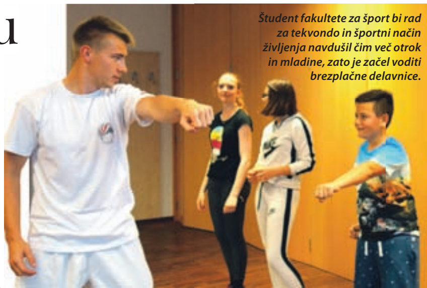
Študent fakultete za šport bi rad za tekvondo in športni način življenja navdušil čim več otrok in mladine, zato je začel voditi brezplačne delavnice.