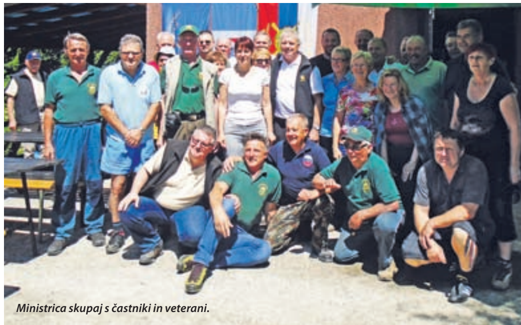
Ministrca skupaj s častniki in veterani.

Delovne točke: »bombarjenje«, streljane z ZP, »klinčkanje« in streljanje na divje prašiče, so bile organizirane na jasi tik pod planinskim domom. Po opravljenih nalogah, so se udeleženci odpravili na planinski dom, kjer je bil cilj pohoda. Prav vsi sodelujoči so pokazali, da so ve-