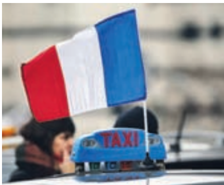
Ob začetku evropskega nogometnega prvenstva so Francijo hromile stavke.

Pred junijsko sejo poslancev so se pogovori v glavnem vrтели okrog interpelacije ministri-