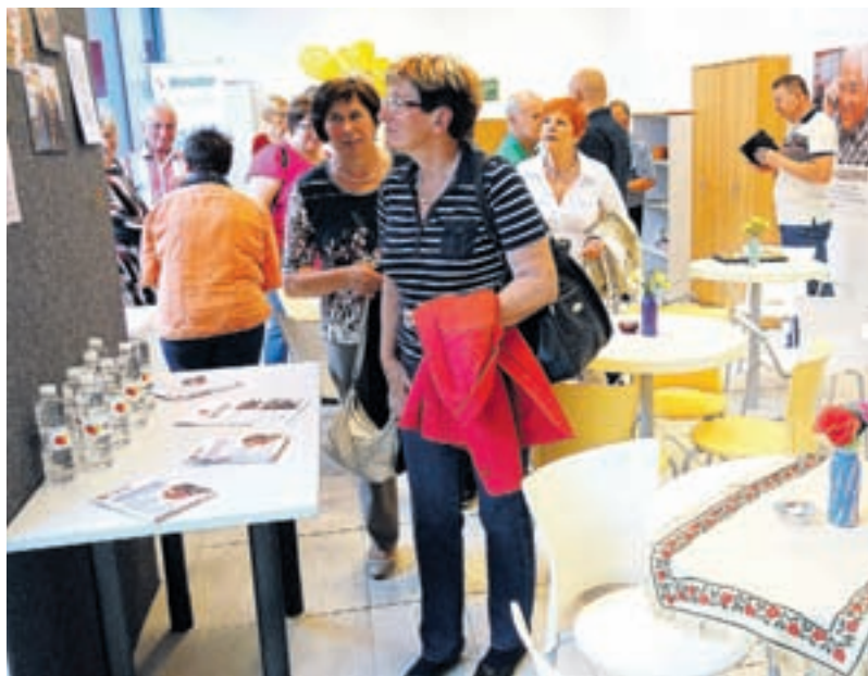
Zlati kotiček se razprostira na 46 kvadratnih metrih, v njem pa lahko preživijo prijetne trenutke 20 do 25 oseb naenkrat.

nje, ter Invalid – društvo gibalno oviranih in oseb z invalidnostjo Konovo. Na vprašanje, ali se ob že dokaj številnih obstoječih dejavnosti za starejše v tukajšnjem okolju še kažejo vrzeli v skrbi za kakovostnejše preživljanje jeseni življenja, pa je Urbašek odgovo-