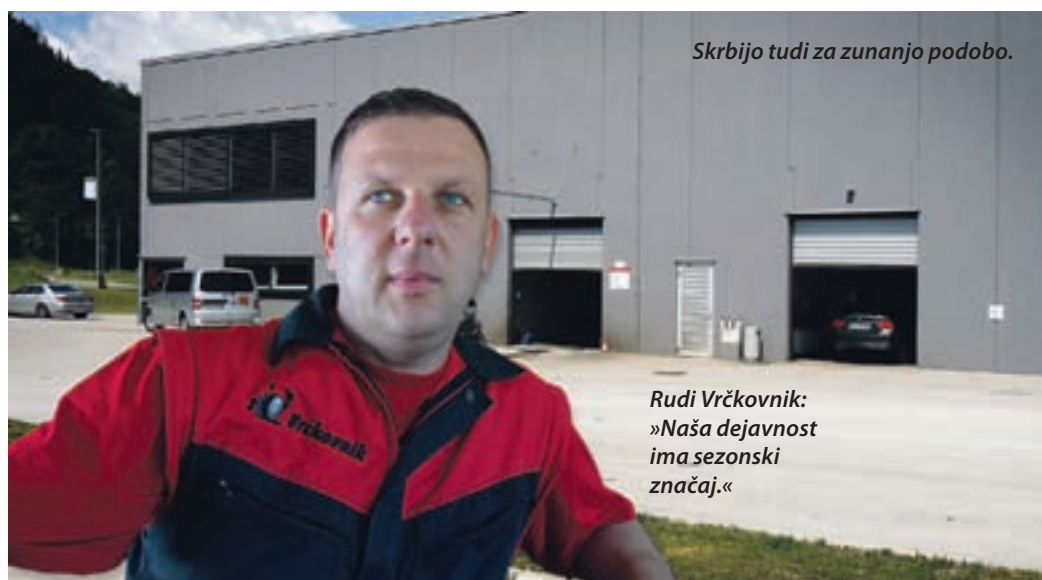
Skrbijo tudi za zunanjo podobo.

Letošnje leto je jubilejno. Zaznamovali ga bodo s prireditvijo, ki jo pripravljajo poleti, ko bodo obiskovalcem na dnevu odprtih vrat predstavili podjetje in pripravili nekaj spremljevalnih dogodkov. Vsega še ne želijo izdati, bodo pa obiskovalci zagotovo lahko občudovali starodobnike in uživali v šovu pranja vozil.