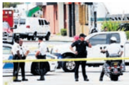
Svet je pretreslo streljanje v gejevskem klubu na Floridi, v katerem je bilo ubitih 50 ljudi.

Predsednica NSi Ljudmila Novak je izrazila prepričanje, da so prav krščanski demokrati pred 25 leti položili temelje nove države.