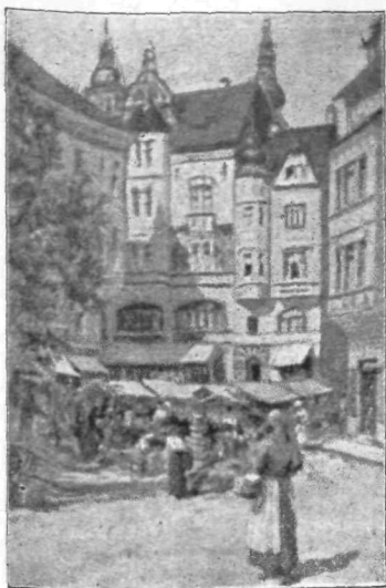
Sadni trg v Celovcu

Šenthelenska gora je danes v nemški državi, v Avstriji, a bil je čas, ko je četa jugoslovenskih vojakov stražila vrh Sv. Helene. To je bilo poleti l. 1919. Žal, je morala jugoslovenska vojna sila Sv. Heleno zopet zapustiti in se nanjo ni več povrnila. Z bridkostjo v srcu je tedaj pisal slovenski vojak karto svojemu prijatelju, ko se je poslavljal od Šenthelenske gore. Z bridkostjo v srcu misli vsak zavedni Slovenec in Jugosloven na to, da smo morali zapustiti severno stražarico slovenske zemlje in se umakniti najprej nazaj do Gline in Krke, pozneje pa celo do vrh Karavank.