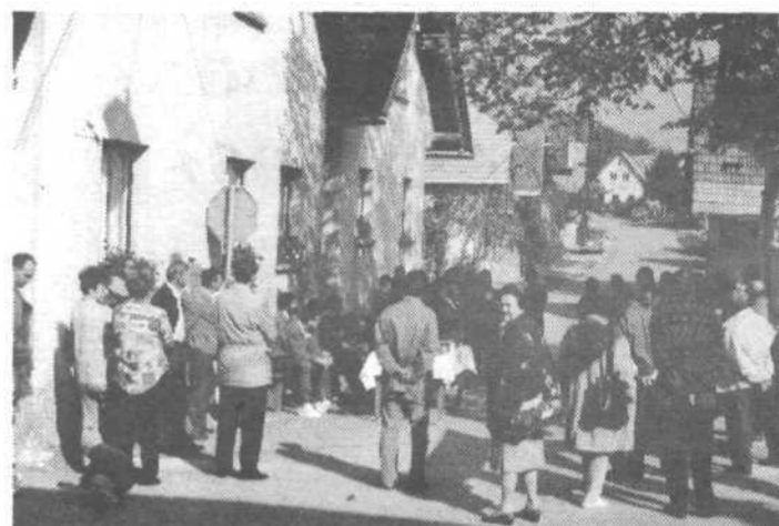
Sprejem pod vasko lipo v Dvorski vasi