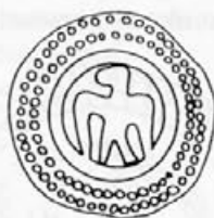
Risba 8: Zaponka iz Burg-Oberwangna, 2. polovica 10. - začetek 11. stoletja, Bern, Bernisches Historisches Museum