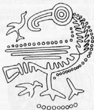
Risba 16: Podoba orla na zaponki iz Darmsheima, 7. stoletje, Stuttgart, Württembergisches Landesmuseum

dobitev, kar se nato na zaponkah shematizira in realizira z bolj tekočo linijo, ki se omejuje na obrise. Način upodobitve perja in repa se tu spremeni v geometrične oblike. Pomembne so tekoče, jasne konture brez ostrih zalomov in prekinitvev. Nekateri orli imajo okrog vratu bulo kot simbol Kristusove zmage. Drugi so upodobljeni s križi ali s črkama alfa in omega, ki prisposobljata Boga Očeta in Kristusa hkrati in se nanašata na Janezovo Razodetje: "Jaz sem Alfa in Omega, govori Gospod Bog, ki je, ki je bil in ki pride, vladar veselja." (Razodetje 1,8) Orli, upodobljeni s svastiko, so povezani s pogansko miselnostjo. Nekateri imajo zraven še manjše ptiče in to se nanaša na 5. Mojzesovo knjigo 32,11. To naj bi bil Kristus, ki s svojim vstajenjem in vnebohodom rešuje duše. 45 Na fibuli iz Wormsa 46 ima orel čisto človeško fiziognomijo z