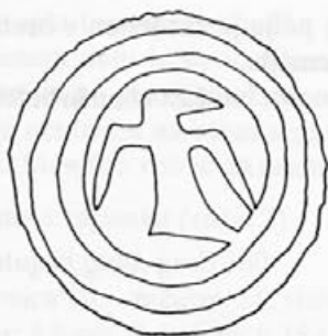
Risba 7: Zaponka iz Krungla, 2. polovica 10. - začetek 11. stoletja, Graz, Landesmuseum Joanneum