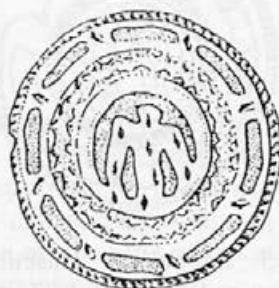
Risba 1: Zaponka iz Kranja, 2. polovica 10. - začetek 11. stoletja, Kranj, Gorenjski muzej