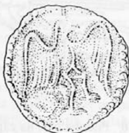
Risba 19: Zaponka iz Kranja, 9. stoletje, Kranj, Gorenjski muzej

Kranjska zaponka iz 9. stoletja 48 (risba 19) je po tehniki podobna merovinškim: železno jedro je prevlečeno z bronasto pločevino, na kateri je iztolčena podoba orla, ki pa je spet bolj realistična. Krila in noge ima močno razširjene, trup in glavo pa obrnjeno v svojo levo. Najbrž ima tudi še isti pomen.