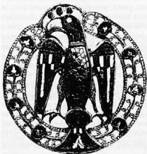
Risba 20: Zaponka iz zaklada kraljice Agnes iz Mainza, 2. tretjina 11. stoletja, Mainz, Landesmuseum

Nadaljnji razvoj orlovske zaponke nam kaže zaponka iz Mainza iz prve četrtnine 11. stoletja (risba 21). 50 Tu se osrednji medaljon predre in ostane le podoba orla razširjenih kril in nog, ozkega trupa in velikega pahljačastega repa. Površina je okrašena z vrezi, krila in rep pa tudi z emajlom, ki ni več ohranjen. Na levo zasukana glava, ki štrli v ozek okvir, je zaznamovana s kljunom in velikim očesom. Na ozkem robu je prepoznaven diagonalni križ s trikotnimi celicami, zapolnjenimi z rdečim in zelenim emajlom. Med križevimi "ramami" so reliefi živali. Premer se poveča na 4,5 cm. Taka podoba orla nakazuje nadaljnji razvoj te sheme čez celoten srednji vek.