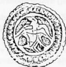
Risba 6: Zaponka iz Žal pri Zasipu, 2. polovica 10. - začetek 11. stoletja