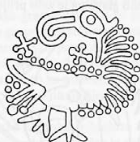
Risba 14: Podoba orla na zaponki iz Deidesheima, 7. stoletje, Speyer, Historisches Museum