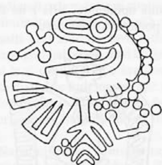
Risba 13: Podoba orla na zaponki iz Berghausna, 7. stoletje, Speyer, Historisches Museum