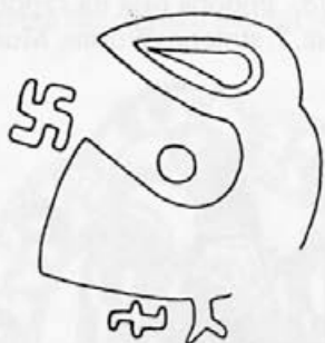
Risba 15: Podoba orla na zaponki iz Berghausna, 7. stoletje, Karlsruhe, Badisches Landesmuseum