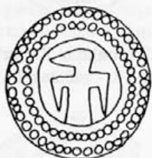
Risba 9: Zaponka iz Mainza, 2. polovica 10. - začetek 11. stoletja, Mainz, Landesmuseum