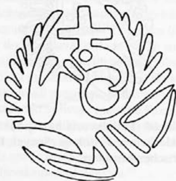
Risba 17: Podoba orla na zaponki iz Lautenhofna, 7. stoletje, Regensburg, Museum

bulo okrog vratu: to je Kristus-orel. Frontalna upodobitev orla z na stran obrnjeno glavo pa je zelo priljubljena tudi v pomerovinškem času. 47