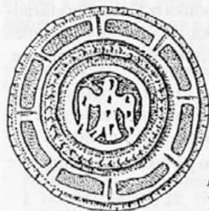
Risba 2: Zaponka iz Ptuja, 2. polovica 10. - začetek 11. stoletja, Ptuj, Pokrajinski muzej