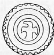
Risba 10: Zaponka iz Trierja, 2. polovica 10. - začetek 11. stoletja, zasebna last