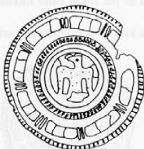
Risba 3: Zaponka iz "Hasenburga", 2. polovica 10. - začetek 11. stoletja, Bern, Archäologischer Dienst des Kantons Bern

Zaponko so našli v ženskem grobu poleg bronaste tordirane ovratnice, treh belobrdskih uhanov, bronastega emajliranega uhana in devetih bronastih obsenčnih obročkov.