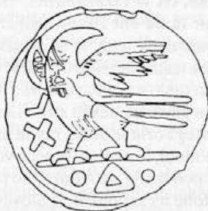
Risba 12: Ostrogotski novc za 40 enot (hrbet)

Od orlovskih zaponk je šest najdenih na področju, kjer so živeli Slovani, dve v okolici Berna v Švici, dve pa v Porenju, Mainzu in Trierju. Našli so jih v krajih, ki so bila pomembnejša središča, zato so jih po vsej verjetnosti nosile ženske iz plemiških družin. 28 Razširjenost orlovskih in drugih zaponk (npr.