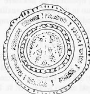
Risba 4: Zaponka iz Slovenjega Gradca, 2. polovica 10. - začetek 11. stoletja, Graz, Landesmuseum Joanneum