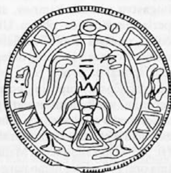
Risba 21: Zaponka iz Mainza, 1. četrtnina 11. stoletja, Mainz, Landesmuseum