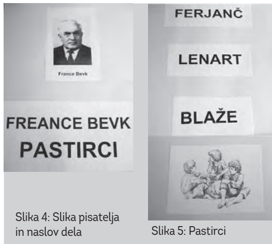
Slika 4: Slika pisatelja in naslov dela

Vodeno branje se dopolnjuje s pogovorom o prebranem in večkratni bolj ali manj (odvisno od učenca in njegovih primanjkljajev) natančni obnovi prebranega. ●