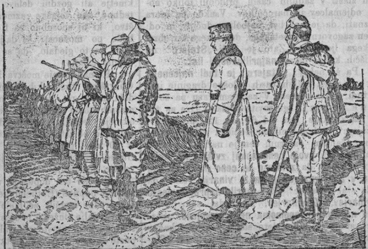
Thronfolger Erzherzog Karl Franz Josef beim Auszeichnen österreichischer Soldaten.

Mladi ali hrabri naš prestolonaslednik nadvojvoda Karl Franc Jožef bil je tekom svetovne vojne skoraj vedno na tem ali onem bojišču, kjer se je sam na lastne oči prepričal o junaštvu naših armad ter potem to prezvišenemu cesarju poročal. Opetovano je prestolonaslednik tudi sam pogumne vojake z zaslužnimi znaki odklikoval. Tak prizor nam kaže današnja elika. Nadvojvoda Karl Franc Jožef odklikuje sam zaslužene vojake.