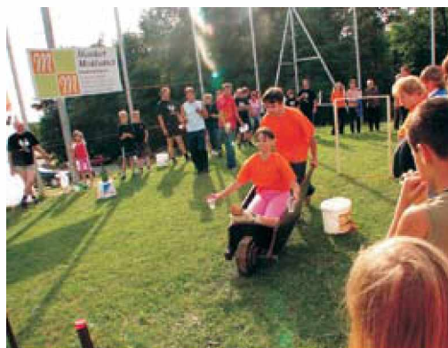
Prevažanje vode v teligah