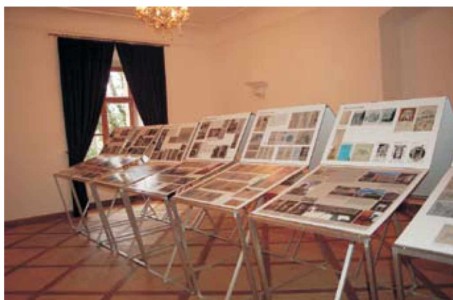
Razstava Plečnikovih del na gradu Grad