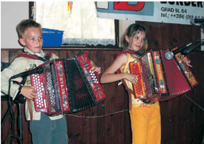
Harmonika je priljubljena tudi pri mladih

prireditve zelo popestrili tudi naši dobri prijatelji iz sosednje Avstrije, ki so zopet dokazali, da so res pravi veseljaki.