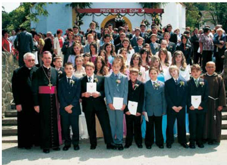
Birmanci z domačim župnikom, škofom in patrom