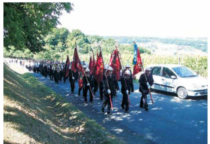
Povorka ob spremljavi pihalne godbe

Gasilstvo je pomembna dejavnost. Pomoč pri požarih, poplavah, potresih,... in še mnogih drugih nesrečah. Pri nas na srečo ni velikih katastrof, vseeno pa se posveča veliko pozornosti usposabljanju in izpopolnjevanju. V današnjem času, ko vsak hiti za zaslužkom na vse konce, ko se mladi šolajo v za nas oddaljenih krajih, je težko uskladiti vse to in najti čas za vse obveznosti, ki jih terja ta prostovoljna dejavnost. Ves ta čas žrtvujete svoj čas za dobrobit nas vseh. Nihče ne zahteva plačila za porabljen čas, niti za opravljene poti, ker vsak zaveden gasilec to dela prostovoljno in z veseljem. Plačilo je hvaležnost, zaupanje in podpora vaščanov ter dobro in vzajemno sodelovanje z lokalno skupnostjo.