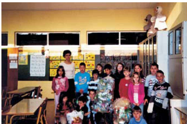
Aktiven 3. razred

Podjetje Saubermacher&Komunala je razpisalo natečaj z naslovom Plastenke – naše prijateljice. Namen akcije je bil vzpodbuditi mlade k pravilnemu ločevanju in oddajanju odpadkov na izvoru njihovega nastanka. Akcija je trajala od 26. februarja do 13. aprila 2007. Za akcijo se je prijavila tudi naša šola, sodelovalo je večina učencev od 1. do 9. razreda. Učenci so aktivno sodelovali in plasteenke prinašali z veliko resnostjo. Še posebej aktiven je bil 3. razred skupaj z razredničarko.