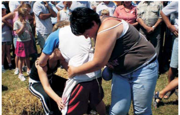
Igra z baloni je vse nasmejala do solz