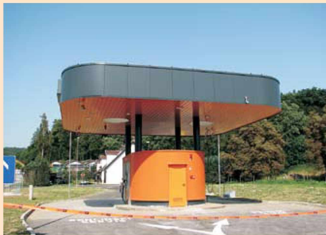
Izgradnja nove bencinske črpalke pri Gradu