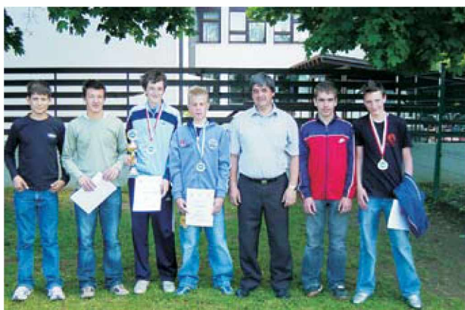
Udeleženci regijskega tekmovanja Kaj veš o prometu

Vsem učencem in učenkam, ki so na področju tehnike dosegli svoj osebni uspeh, še posebej pa tistim, ki so na regijskih in državnih tekmovanjih zastopali šolo, občino in regijo ter zasedli najvišja mesta, iskreno čestitam.