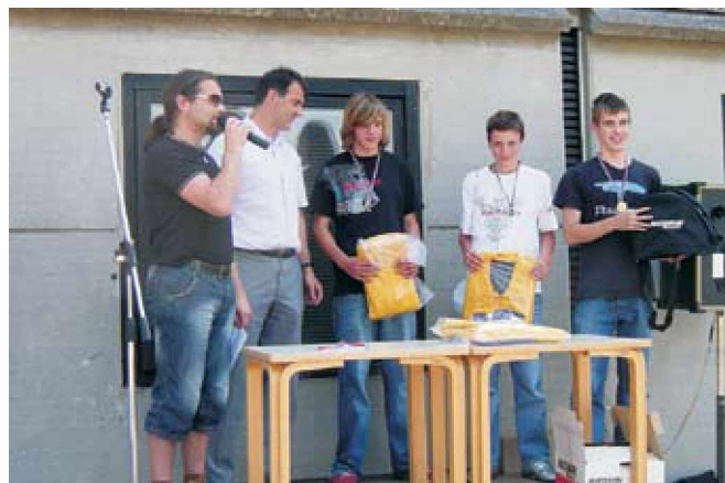
Mitja v družbi zmagovalcev

Kljub kadrovski spremembi na področju mentorstva šola kontinuirano skrbi za varnost v cestnem prometu in za izobraževanje na področju cestno-prometnih predpisov. Prometni krožek je obiskovalo 14 učencev. Z znanjem, ki so si ga pridobili v šoli, so se učenci