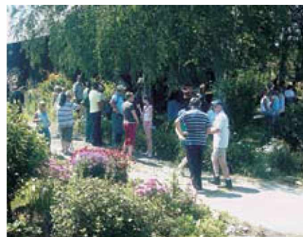
Prijeten počitek v senci