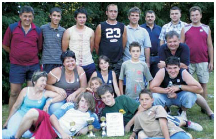
Zmagovalna ekipa ŠRD Dolnji Slaveči