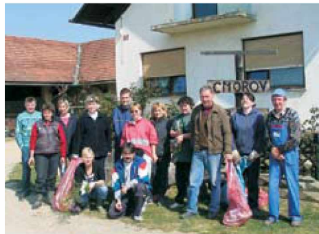
V Motovilcih so družno čistili »Peški« in »Lukaj«