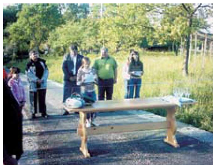
Otvoritev cestnih odceпов v Kruplivniku