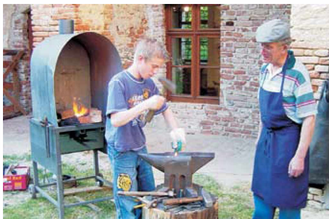
Kovač je zanimiv, a težak poklic