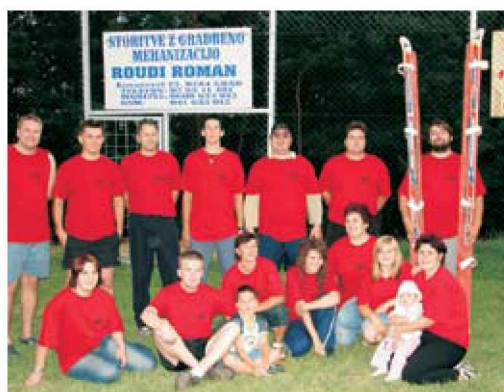
Zmagovalna ekipa Pozvekov breg