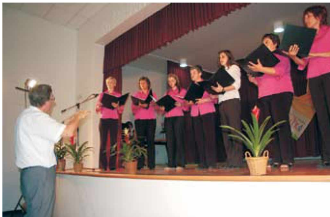
Vokalna skupina Zarja