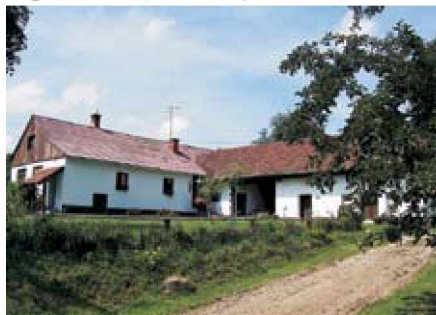
Prenovišče R70