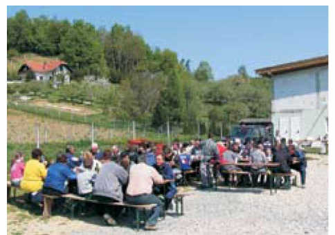
Udeleženci akcije so se okrepčali z bogračem