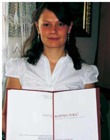
Klavdija s prejeto diplomom

Študij medicine traja 6 let in je v grobem razdeljen na dve obdobji. Prva tri leta so namenjena predkliniki, torej spoznavanju fizike, biokemije, fiziologije, patologije..., skratka temu, kako človeško telo funkcionira. Zadnja tri leta pa so praktično naravnana in posvečena spoznavanju kliničnega dela. Učili smo se, kako pristopiti do bolnika, razmišljati o možnih diagnozah in seveda pravilno ukrepati. Ker praksa brez poznavanja teorije ni dovolj, smo imeli tedensko obvezne kolokvije, izpite, ki so trajali tudi po več dni. Diplome nam ob koncu študija ni bilo potrebno narediti, vendar pa je vseeno večina študentov zelo raziskovalno usmerjenih. Tako sem tudi jaz še z dvema kolegom dobila Prešernovo priznanje za raziskovalno delo na področju ne-