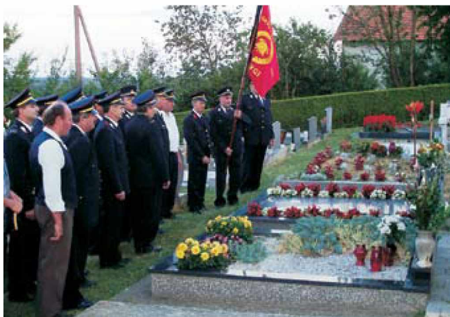
Počastitev pokojnih gasilcev

1. julija 2007 je Prostovoljno gasilsko društvo Radovci praznovalo svojo 70-letnico obstoja. Kakšni so v resnici bili prvi koraki, koliko žuljev, prostega časa in požrtvovalnosti je bilo potrebno vložiti, bi nam lahko povedali le začetniki. Verjetno bi pa slišali, da je bila vsa ta dolga pot posuta z mnogimi grenkimi izkušnjami, z večkrat povzdignjenimi glasovi, z mnogo vložene delo, na drugi strani pa tudi s smehom in zabavo.