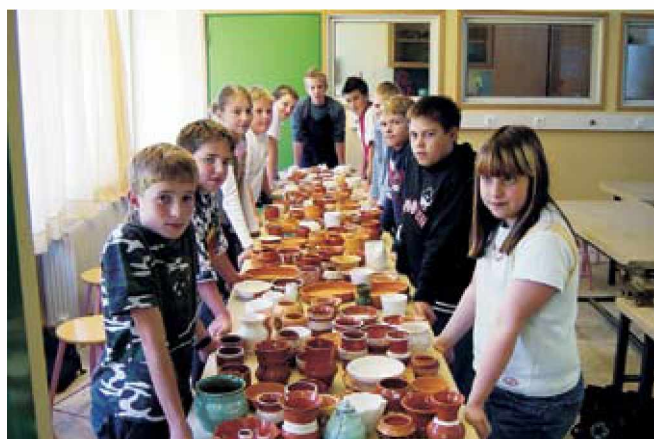
Mladi lončarji ob svojih izdelkih

Razvoju lončarskega krožka lahko sledimo iz leta v leto. Na šoli je vse več učencev, ki samostojno lončarijo in obvladajo tudi tehnike glaziranja in žganja izdelkov. V sodelovanju z Javnim zavodom Krajinski park Goričko smo predstavili lončarjenje gostom iz Banovcev, kjer so naši učenci bili mentorji predvsem mlajšim obiskovalcem. Svoje znanje so mladi lončarji pokazali tudi na mednarodnem taboru Lončarstvo nekoč in danes, ki je potekal od 25. do 29. junija letos na Madžarskem.