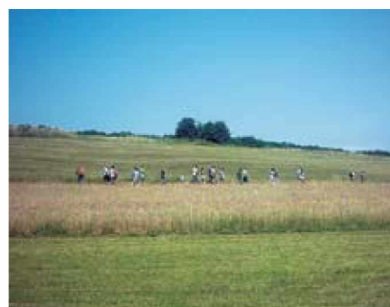
Pohodniki v Kruplivniku