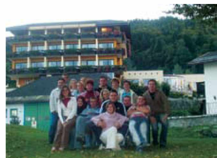
Člani ŠD Kovačevci na izletu