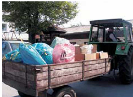
Smeti so se po vseh vaseh kar nabirale

Ker je 22. april svetovni dan Zemlje, vsako leto skušamo v njeno počastitev obuditi zavest ljudi o pomembnosti lepega in čistega okolja, v katerem živimo.