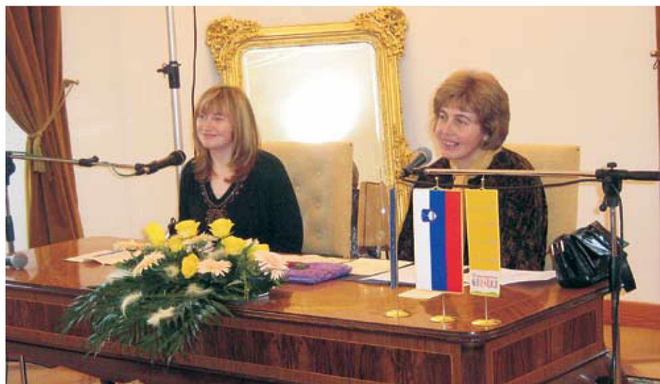
Predstavitve knjige na gradu Grad