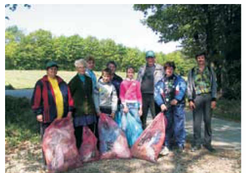
Skupina v Kruplivniku