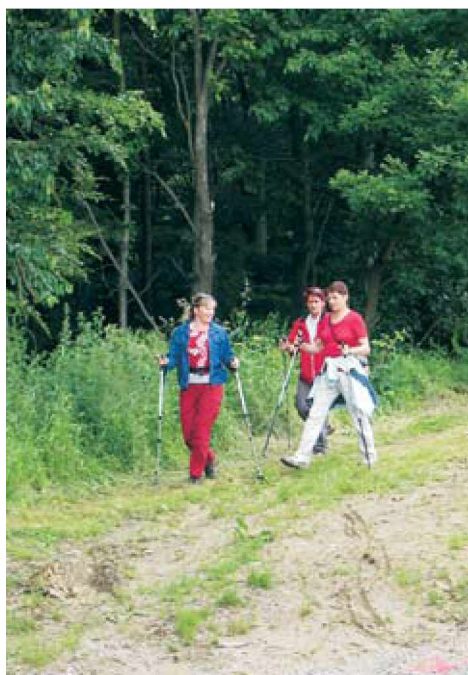
Pohodniki so se razkropili na poti

Pohod je potekal izpred gasilskega doma na Dolnjih Slavečih. Naprej je pot pohodnike vodila do Kruplivenika, kjer so postali ob Belem Križu - kužnem znamenju, kjer so se lahko tudi okrepčali. Pot jih je vodila dalje, čez hribe in doline, ko so prišli do Kripte - grobnice grajske gospode, kjer so se lahko ponovno okrepčali. A pot jih je seveda vodila naprej mimo gradu in skozi naselje Grad nazaj do samega cilja. A preden so se lahko veselili cilja, so morali prehoditi še kar precejšen del poti. Pot proti Dolnjim Slavečem so nadaljevali čez Kukojsko, kjer so si