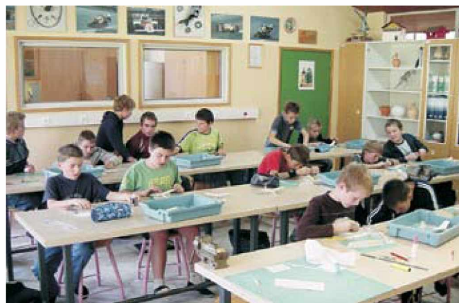
Učenci v tehniški delavnici

Ob pouku tehnike in tehnologije otrokom nudimo izbirni predmet obdelava gradiv, modelarski krožek, lončarski krožek, prometni krožek, izvajamo tehniške dneve in se udeležujemo tekmovanj s področja tehnike na regijski in državni ravni.