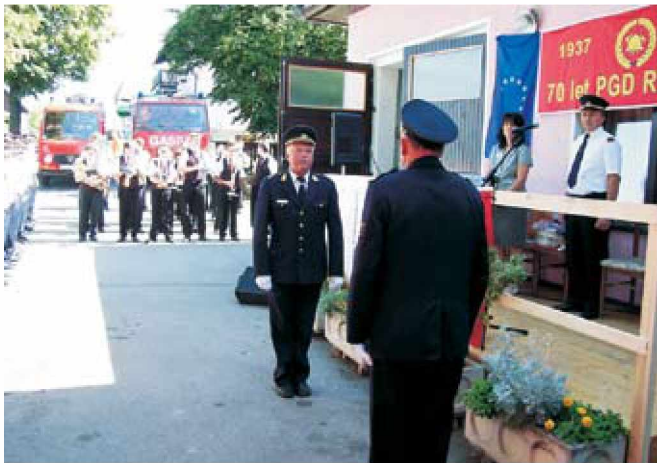
Pozdrav predsednika GZS in poveljnika GZ Občine Grad