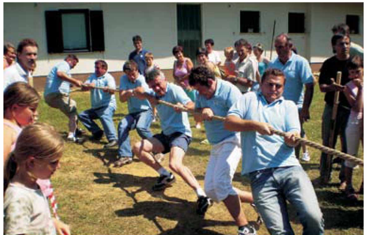
ŠD Kovačevci – vladarji vrvi