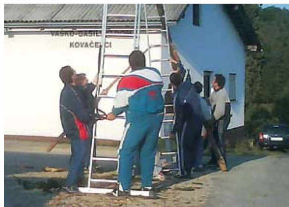
Mlaj smo postavili ob gasilskem domu

Kot vsako leto smo tudi letos tradicionalno praznovanje 1. maja, praznika dela, v Kovačevcih obeležili s postavljanjem mlaja in prižigom kresa. Zbralo se je mlado in staro, ki se je ob jedaci in pijači družilo pozno v noč.