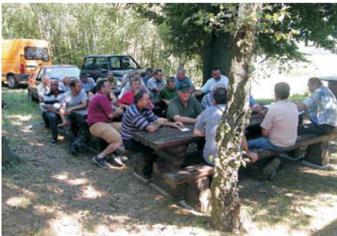
Člani LD Radovci ob Lovskem domu

Začetki lovske družine Radovci segajo v daljno leto 1945, ko je bila posredovana vloga za ustanovitev, ki je bila realizirana 07.10.1946. To je hkrati tudi datum ustanovitve LD Radovci. Eden izmed prvih ustanoviteljev, oziroma prvi podpisnik, seveda skupaj z