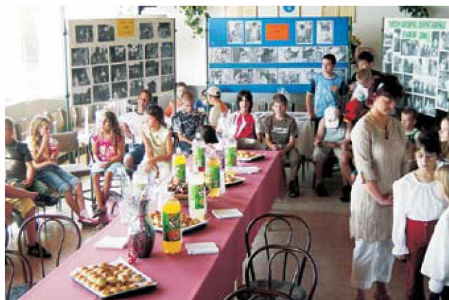
Otvoritev lončarskega tabora na Madžarskem