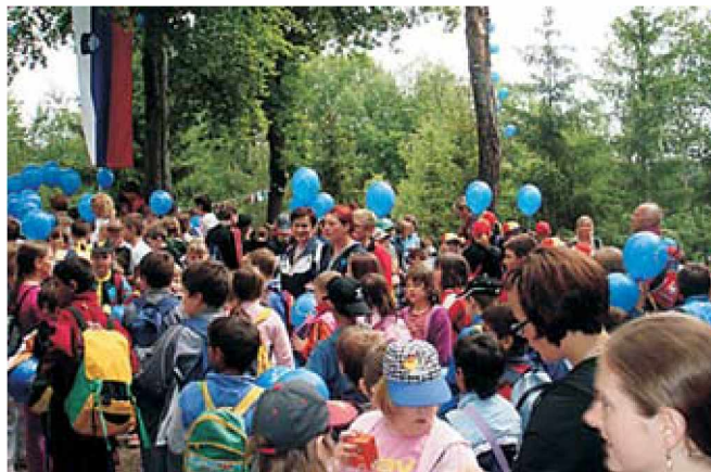
Dan Evrope na Tromeji