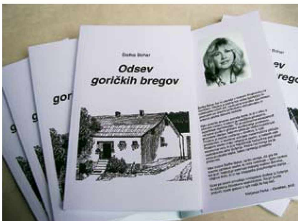
Odsev goričkih bregov