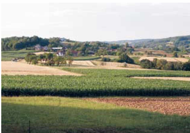
Osrednji del lovišča LD Radovci

Člani lovske družine smo ponosni na dosežene uspehe, kakor tudi na preminule člane, s katerimi smo soustvarjali in prehodili mnogo lovskih poti