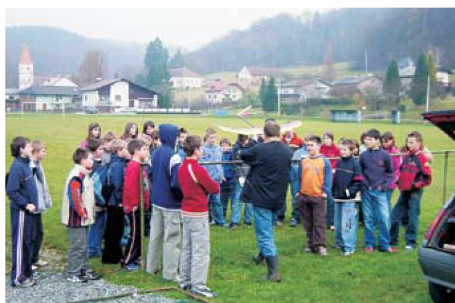
Ogled radijsko vodenih modelov