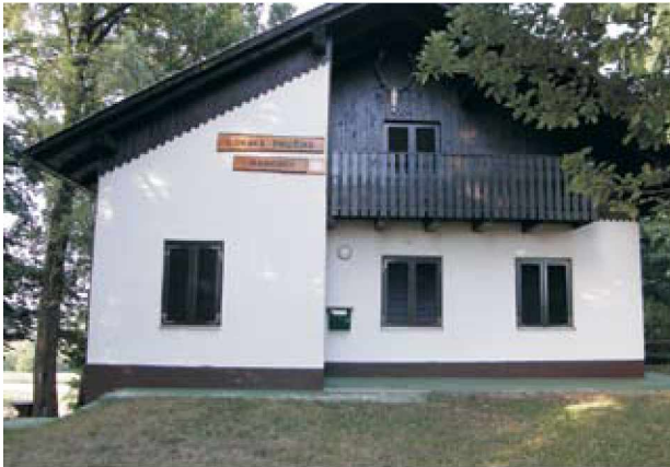
Pogled na prelep objekt LD Radovci

V mesecu juliju 2006 je Lovska družina Radovci praznovala svojih častitljivih 60 let, vendar zaradi prenatrpanosti prireditev v občini in v njih delujočih raznih društev ni bilo možnosti izvesti tega praznovanja. Tako smo se odločili, da ta naš jubilej proslavimo 22.07.2007, torej na isti dan, ko smo leta 1999 s triletno zamudo zaradi dokončanja gradnje lovskega doma praznovali 50 letnico obstoja.