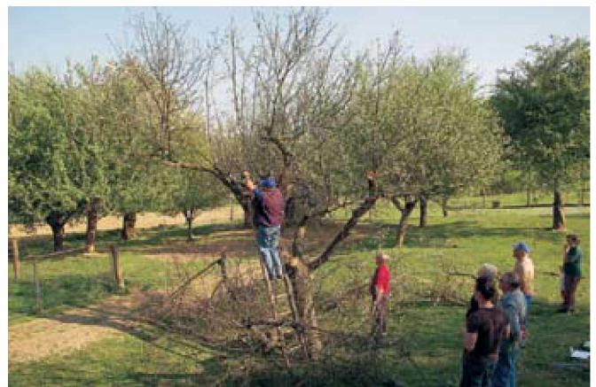
Obrezovanje sadnih dreves