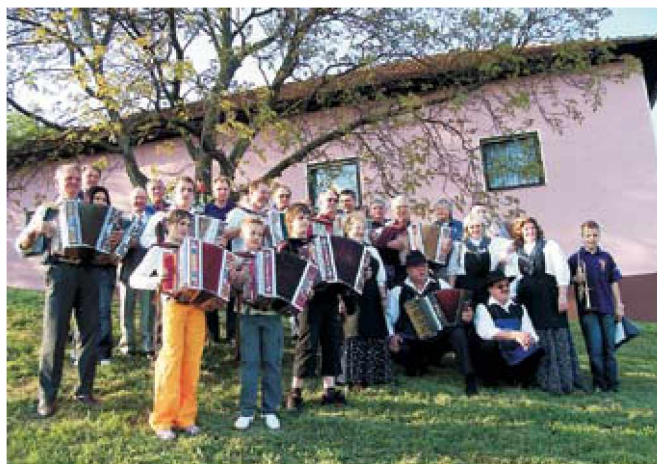
Zbrani harmonikarji

V mesecu aprilu je v Radovcih bilo organizirano in izvedeno že 19. tradicionalno srečanje harmonikarjev. Na omenjenem srečanju so znanje v igranju harmo-