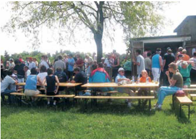
Počitek in okrepčilo sta bila dobrodošla