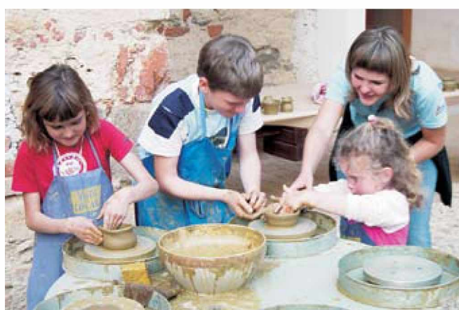
Ko boš velika, bo šlo lažje