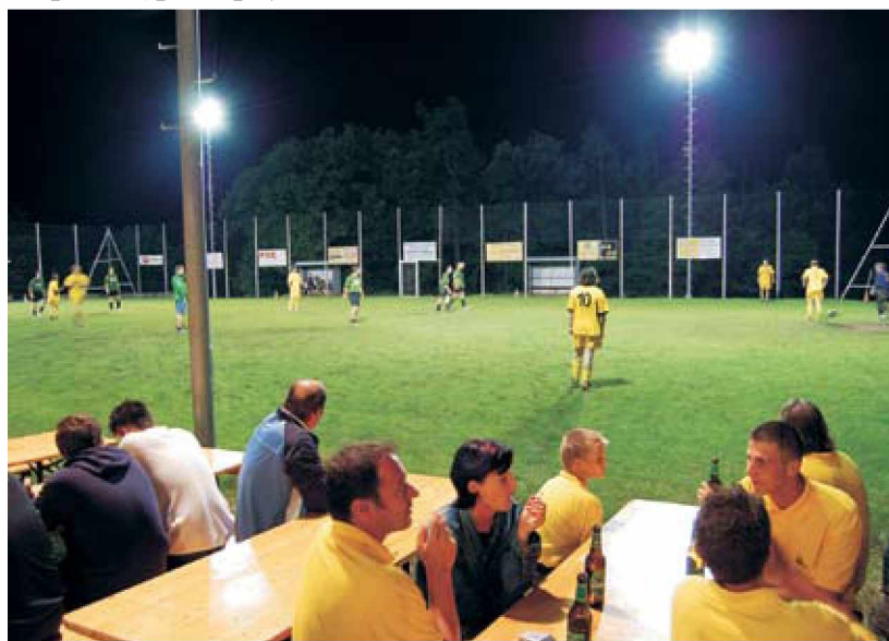
Srečanje z ekipami iz Avstrije

Letos, 8. junija, smo ponovno organizirali prijateljsko in družabno srečanje z ekipami iz sosednje Avstrije ter ekipami prijateljskih klubov, in sicer: Vidonci, Otovci in Matjaševci. Turnir je potekal v prijateljskem vzdušju, zato so tudi same ekipe igrale v mešanem sestavu, kar pomeni, da se je srečanje končalo brez zmagovalca, važno je bilo druženje in sodelovanje. Člani avstrijskih ekip iz okolice Dunaja so našemu društvu podarili tri nogometne žoge v upanju na nadaljnje uspešno in prijateljsko sodelovanje. Razšli smo se pozno ponoči, polni prijetnih vtisov.