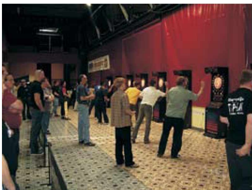
Državno prvenstvo v pikadu

V soboto, 21. aprila 2007 je bilo v Velenju - Rdeča dvorana državno prvenstvo v elektronskem pikadu. Ker je tudi občinska pikado liga Grad nastopala v državni ligi, so se prve tri ekipe uvrstile na ta turnir, in sicer: Friend's team (Sveti Jurij), Dva v enem (Kovačevci) in Goričanka (Radovci). Tako smo se turnirja tudi udeležili. Na turnirju smo lahko videli najboljše igralce s celotne Slovenije. Preživeli smo lep dan in upam, da smo se od njega tudi kaj naučili («pikado seveda»).