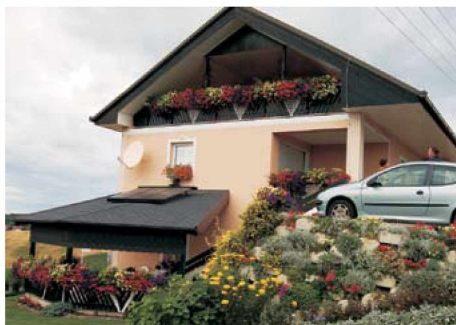
Majda in Alojz Sukič, Vidonci 120/a