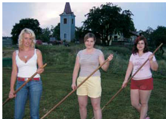
Dela na igrišču v Kovačevcih