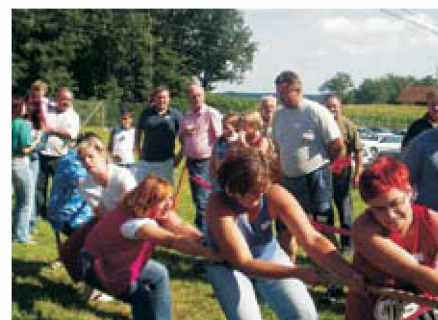
Vsako leto merimo našo moč na vaških igrah