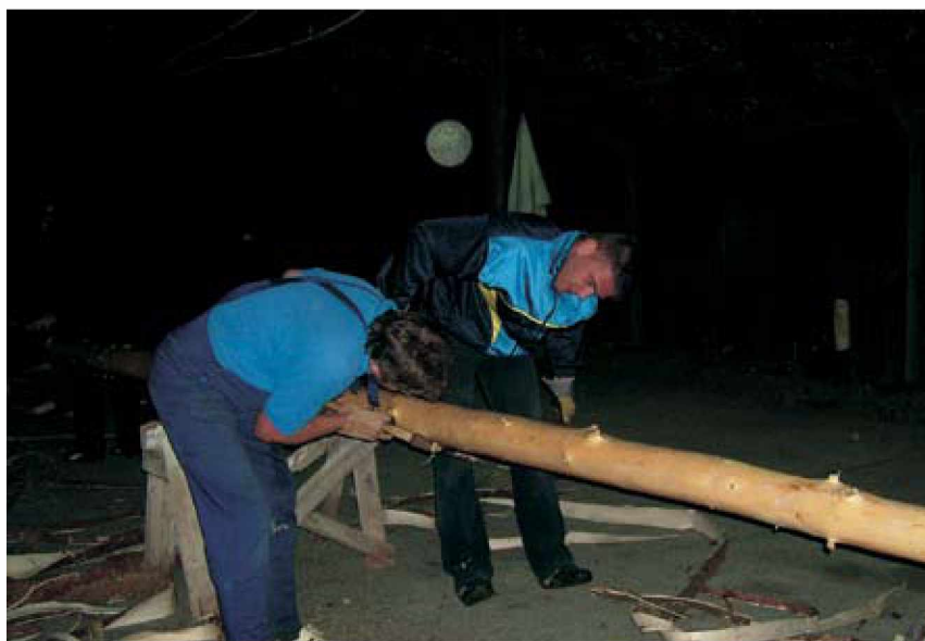
Postavljanje mlaja na Dolnjih Slavečih.

Leto teče z neprestano hitrostjo. Tako nas dnevi že skorajda prehitvajo. Ob takem ritmu življenja smo dočakali tudi 1. maj - praznik dela. Na prelepi večer, ko se je dan prevešal v noč in nas je hladil rahel vetrič po napornem dnevu, čeprav bi naj bil to dela prost dan, so morali mnogi poseči po raznih opravilih. A kljub temu so se zvečer udeležili kresovanja v čast 1. maju - prazniku dela. Zbrala se je namreč številna množica vaščanov in vaščank, ki so lahko ob ognju poklepeta-li, se okrepčali in tudi kakšno zapeli. Vzdušje je bilo prijetno tudi dan prej, ko so fantje ter moški poskrbeli, da se je ponovno postavil mlaj, in to kar pred gasilskim domom kakor tudi pred gostilno na Dolnjih Slavečih, ki še obratuje.