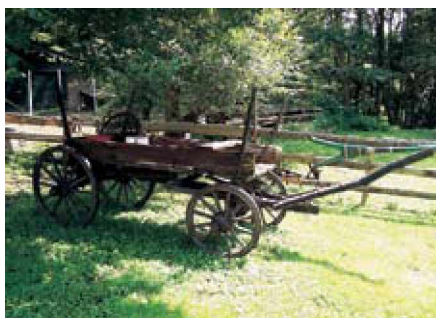
Lepa okolica