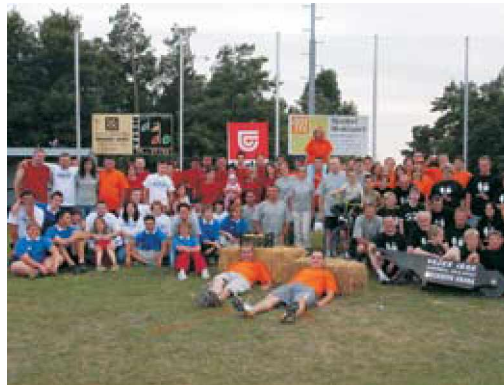
Vse ekipe na vaških igrah