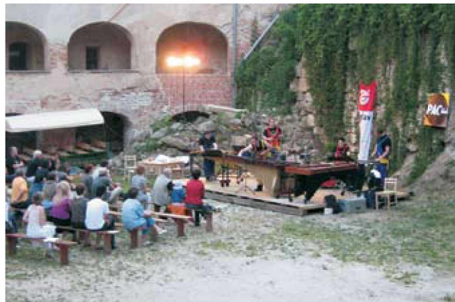
Nastop skupine SToP (foto in tekst: Š. Fujs)

26. maja se je na grajskem dvorišču predstavila skupina Slovenski tolkalni projekt »SToP«. Skupina deluje že