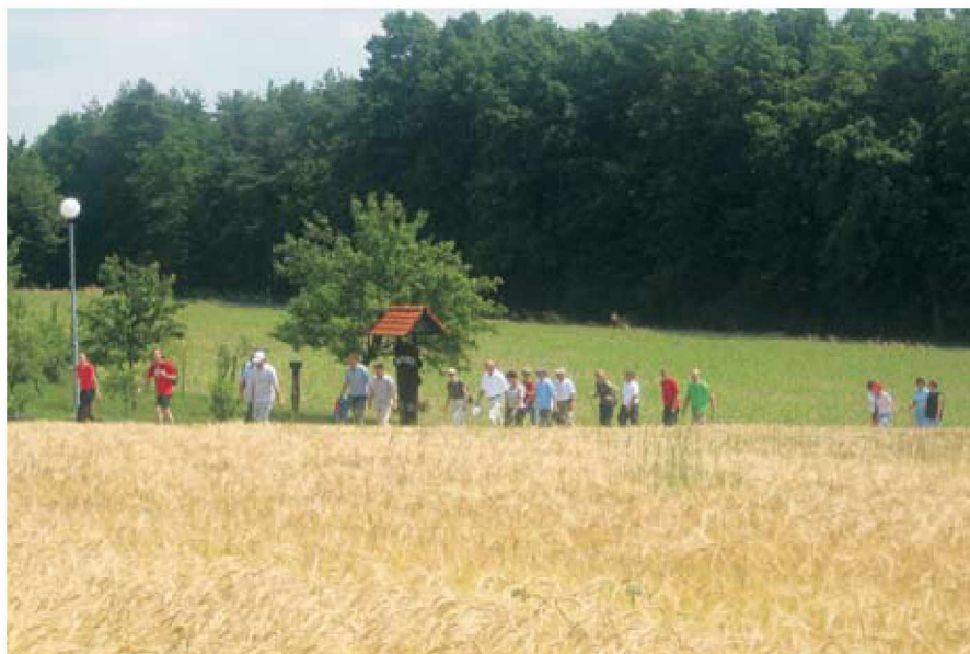
Prijetna pot med polji

»PEŠKI« društvo za rekreacijo in sprostitev Motovilci je letos organiziralo že 6. tradicionalni pohod po Motovlcih. Pohod je bil 3. junija 2007, tokrat po malce drugačnem programu kot prejšnja leta, in sicer je bil pohod organiziran s skupnim štartom vseh pohodnikov izpred gasilsko-vaškega doma.