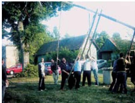
Postavljanje mlaja ob gasilskem domu

Že nekajletni tradicionalni vaški piknik in postavljanje mlaja pri Belem križu ter vaško-gasilskem domu na predvečer 1. maja je bilo izvedeno tudi letošnje leto. Istočasno je bila otvoritev novo asfaltiranih cestnih odceпов: odcep h gasilskemu domu, povezava od Rajnigara do Reckove ceste z izgradnjo in razširitvijo mostu in Kakerjev odcep.