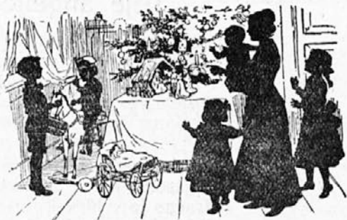
Sveta noč, blažena noč...