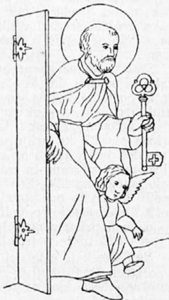
Tedaj pride skozi rajska vrata sv. Peter s svojim ljubljencekom ...

Angelčki so privalili novo bombažasto balo. Hoteli so se že spraviti nanjo, toda sv. Peter jim tega ni dovolil, češ da je že prepozno in da bo treba iti v raj spat. Mali Cibek je med tem splezal na balo in veselo frfotal s perutničkami, sv. Peter pa je krilil z zlatim ključem in podil angelčke v nebesa. Pri tem je pa nehote ošvrknil balo, na kateri je sedel ljubeznivi Cibek. Bala se je zazibala in zdrknila po oblaku navzdol.