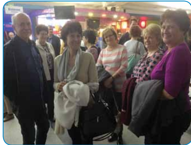
Sombotelski Slovenci so si ogledali celo več filmov

slovenski diplomat, ki si rad ogleda filme drugih narodov, najsi gre za Irance, Portugalce, Madžare ali Nemce. »Filmi prikazujejo probleme