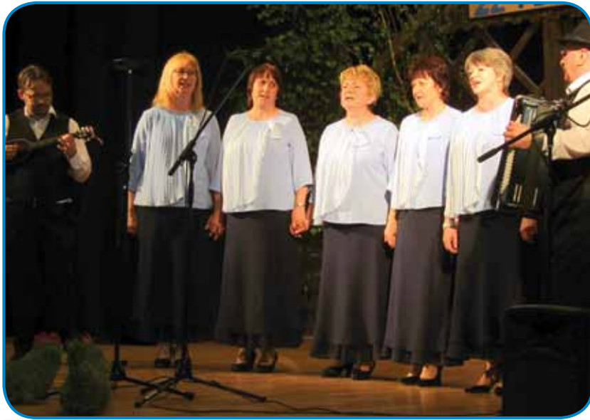
Sombotelske spominčice so v Mozirje pripelale dve stari porabski pesmi

do smrti,« je končo župan pa prejkau oder skupinam.