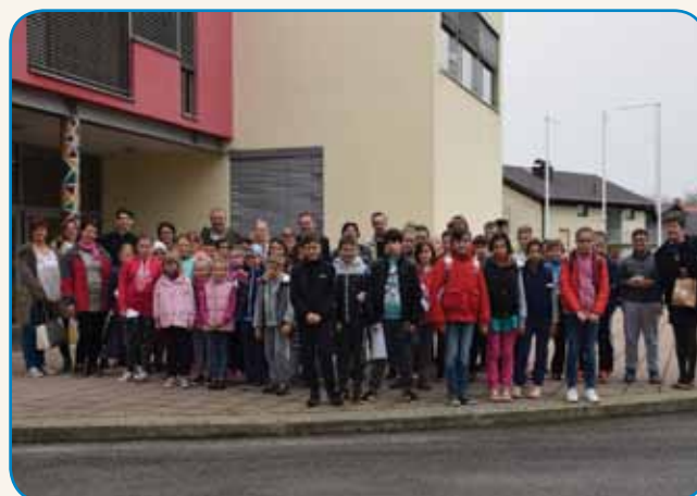
SKUPNI ŠOLSKI DAN V PREKMURJU stran 10