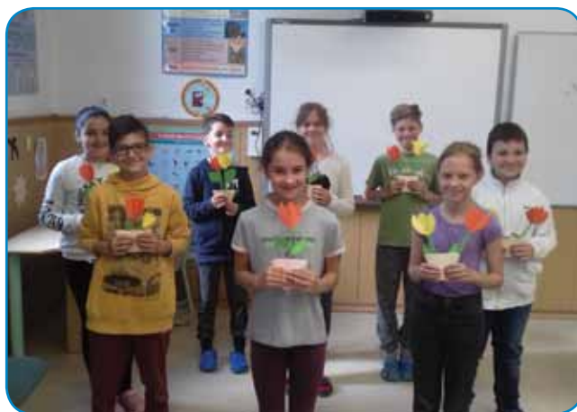
Učenci bodo mamicam poklonili tudi ročno izdelane tulipane

Vsak izmed učencev je dobil del stavka: „Moja mama je