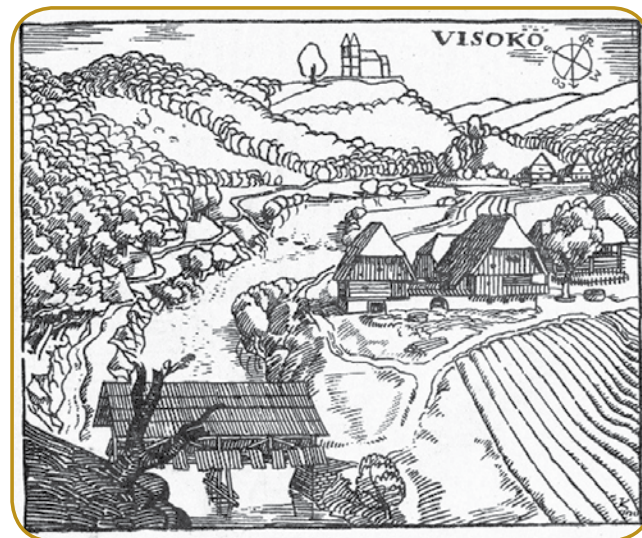
Vesnica, gde se godi Visoška kronika - v Tavčarovo Poljanskoj dolini

V Tavčarovo knjigi, štera je napisana v formi kronike v prvoj osebi, lidi ženéjo kmična čütenja, depa velke lübezni pa etična spoznanja ranč tak. Razklani so med dva svejta: indašnji svejt stare religije s šatringami pa nauvi svejt razmenosti pa slobaudnoga odlaučanja. Fundament žitka