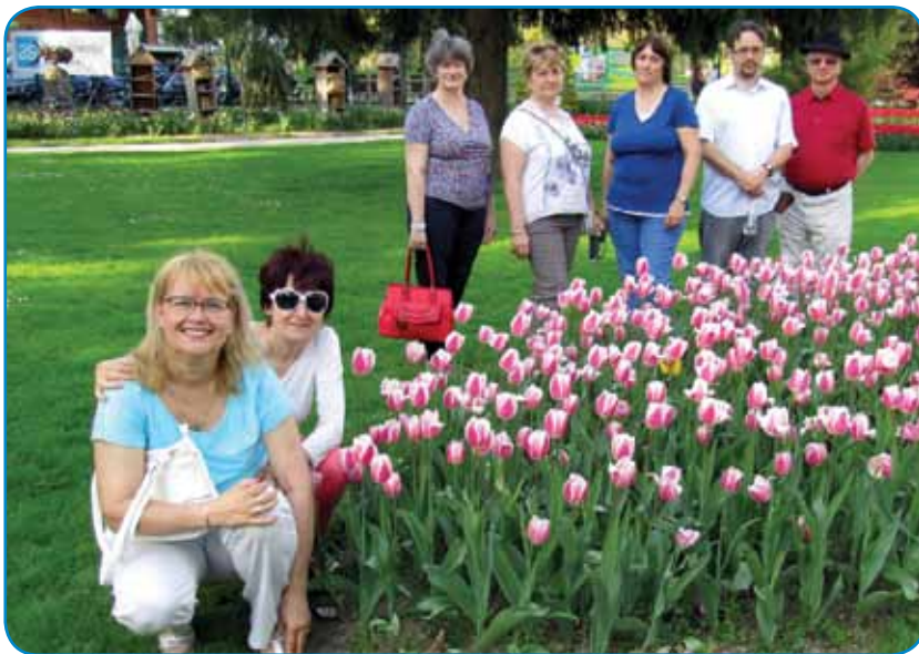
Raužice med tulipani

nej svoje domanje ljudske pesmi peli pa ka sta na priliko dve prekmurski držini zvekšoga nauté z ov kraj Müre spejvali.