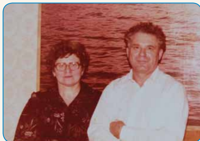
Z dvömi kanti sem majter nosila stran 8