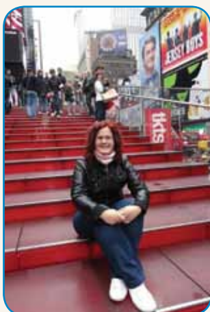
PISATI IN GUČATI, JI JE FURT ŠLO stran 4