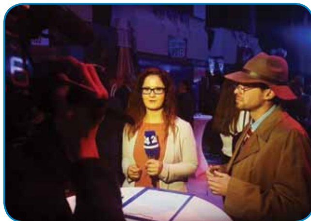
Več kak deset let je delala v Ljubljani na POP TV

trno rada, pa tüdi športa nej. Najbole me je čemerilo, ka si te po tistom zašvicani mogo v klopi sedeti. Če se je dalo, sam se tomi ognila, čiglij je tau bole žmetno šlo. Pisati in gučati mi je rejsan furt šlo. Po zgotovleni osnovni šauli