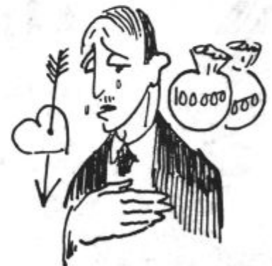
Ženitev iz ljubezni.