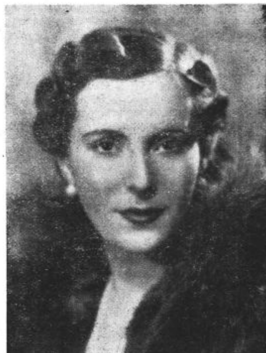
Slavna češka pevka Jarmila Novotná. V petek smo jo slišali tudi v Ljubljanski operi v »Prodani nevesti«.

V februarju je na vrsti Rado Murnik. Njegovi »Navihanci« so kot izrazito humoristična knjiga eden izmed resničnih triumfov slovenskega humorja. Take okrogle šale bi bile dobrodošle tudi danes, ako bi se kdo našel, da nam jih — našim časom primerne — napiše. Rado Murnik je bil čist humorist. Nič mi ni všeč v svoji drugi skrajnosti, kjer slika samo črnino in mračnost. Bil je mojster jezika in znal je izvrstno karakterizirati svoje junake. Nadaljeval je tradicijo našega humorističnega slov-