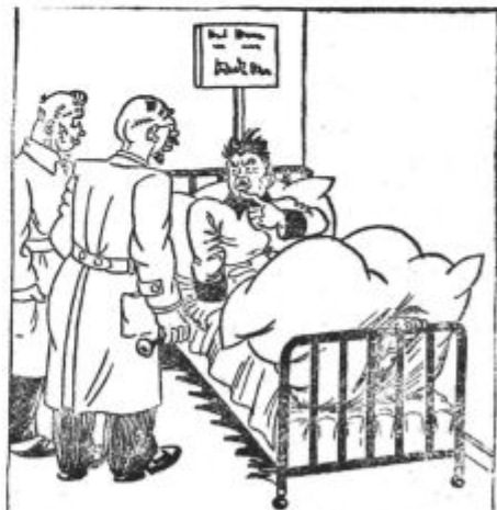
Kaj mislite, gospod doktor, ali je res tako nevarno, kot pravi žena?

20 Oddaja v angleščini. 20.30 Oddaja v nemščini na valu 48.47 m, oz. 49.75 m, 6190, oz. 6030 kc/s.