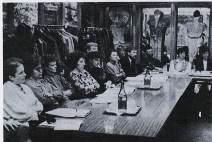
Za delegate delavskega sveta podjetja in vodilne delavce je bil organiziran zanimiv seminar. Vsebine so bile tako zanimive in aktualne, da ni bilo nikomur žal proste sobote.