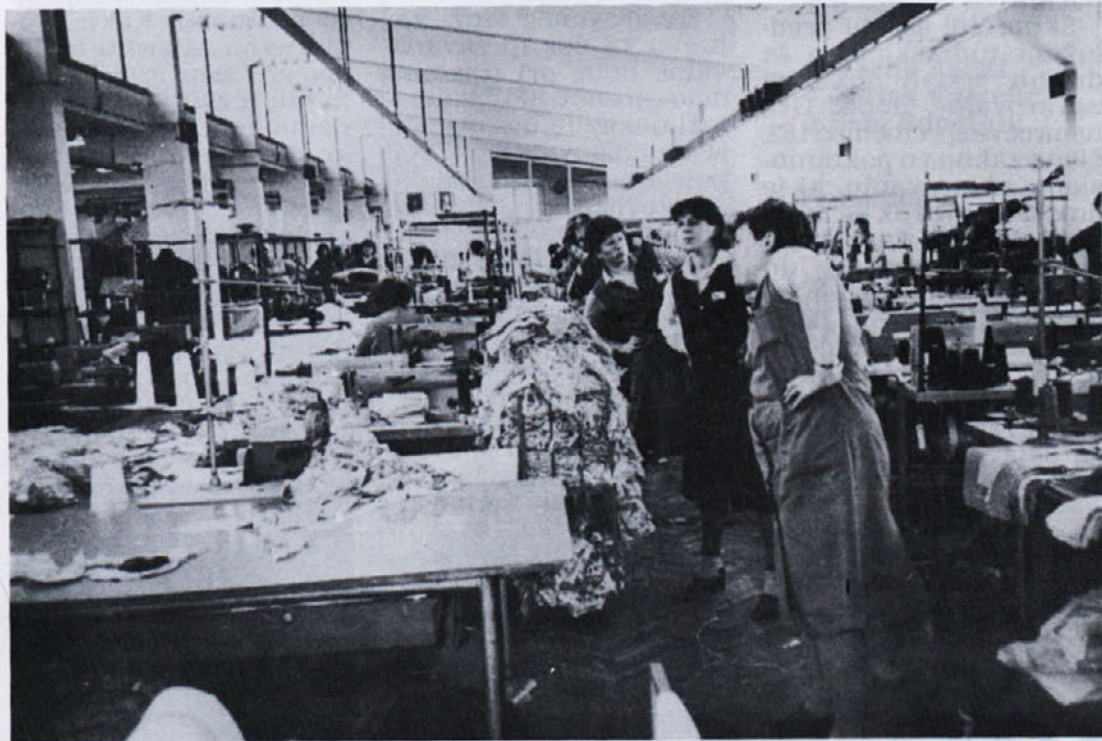
Delavke v Zali in Libni še telovadijo med delom, kar je gotovo pohvale vredno. V Zali pravijo, da vztrajajo tiste, ki imajo težave s hrbtenico in tako komaj čakajo čas za razgibavanje. Tisti, ki jih te težave še ne tarejo, pa se premalo zavedajo vrednosti preventive.