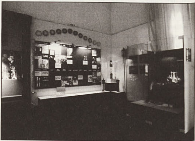
Izsek iz razstave Udomačena svetloba.

V prvi razstavni dvorani je najprej predstavljen tematski sklop Luč v domovih . Ko obiskovalec vstopi v ta prostor, ima na levi najprej pred očmi čelešnik in na desni na vrvi obešeno žarnico, ki sveti. Obe svetili simbolizirata prikaz osvetljevanja po domovih večinskega slovenskega prebivalstva od osvetljevanja z lesom do električne razsvetljave. Med tema dvema skrajnostima so predstavljena še različna druga svetila: odprto ognjišče - svetilo, svetloba bakel, razsvetljava z rastlinskimi in živalskimi maščobami, razsvetljava s svečami (voščeniimi, lojenimi, stearinskimi, parafinskimi), ob tem načinu osvetlitve so predstavljeni tudi različni tipi svečnikov. Sledi predstavitev razvoja razsvetljevanja po letu 1860 s svetili na petrolej, plinskimi lučmi, lučmi na karbid in ob koncu 19.