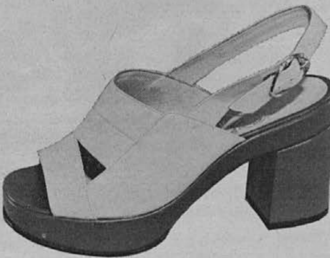
Eden najboljših prodajnih modelov za poletje