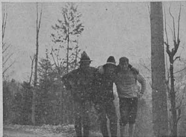
Naši planinci — uživajo lepoto narave

Hodili smo po grebenu, ki loči Primorsko od Gorenjske, proti vrhu Vogla. Greben je oster in na bohinjski strani