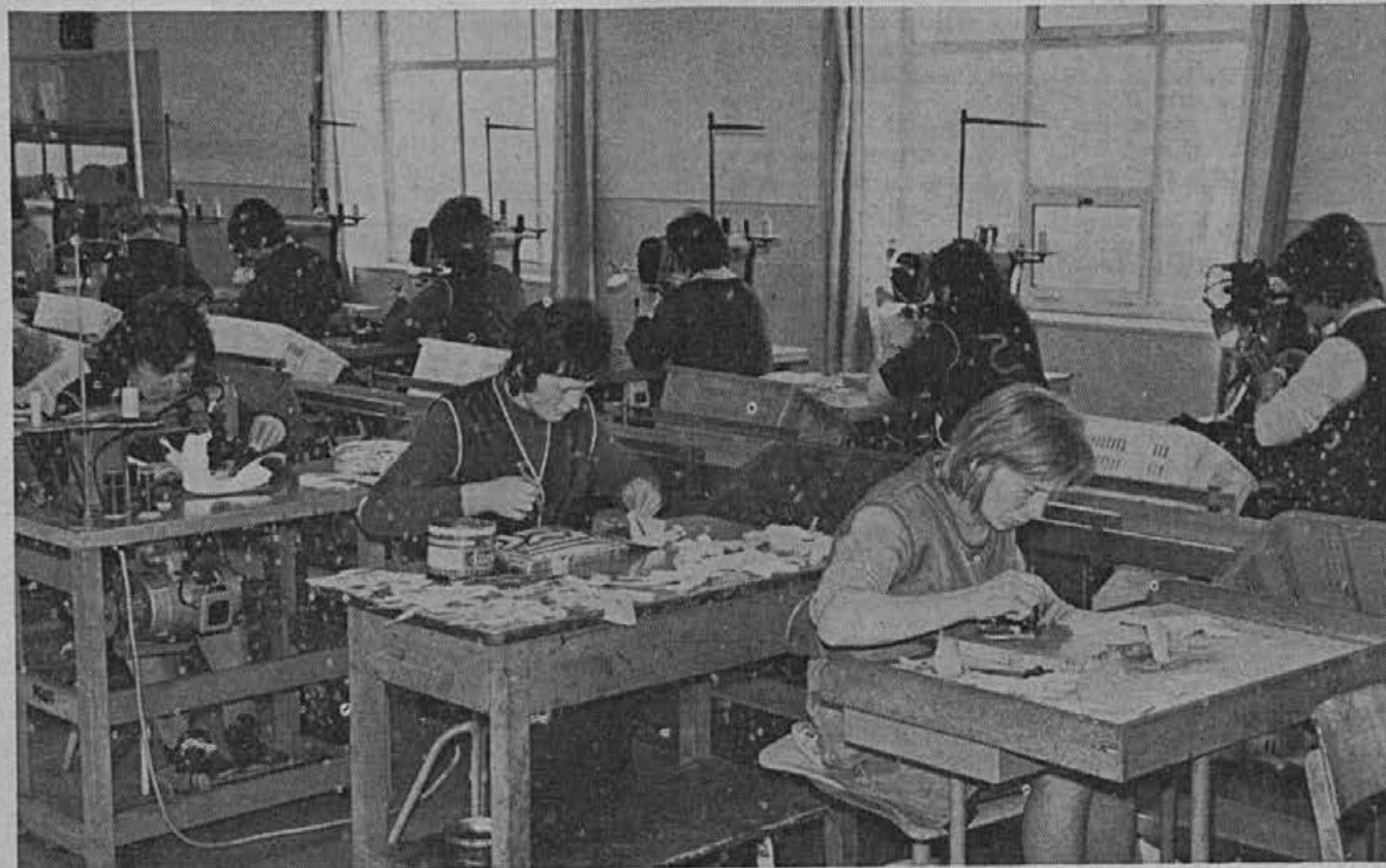
Tudi pridne roke, brez stroja, mnogo napravijo. Posnetek iz našega obrata Gorenja vas