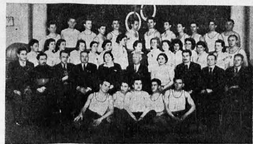
Župski tečaj u Kragujevcu (Vidi članak na str. 5)

Sokolsko društvo Duga Resa priredilo je 7 maja proslavu Majčinog dana, pred punom dvoranom. Čist prihod namenjen je fondu za zimsku pomoć.