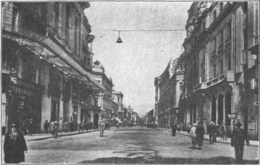
Mihajlova od „Akademije nauka“ proti Kalimegdanu