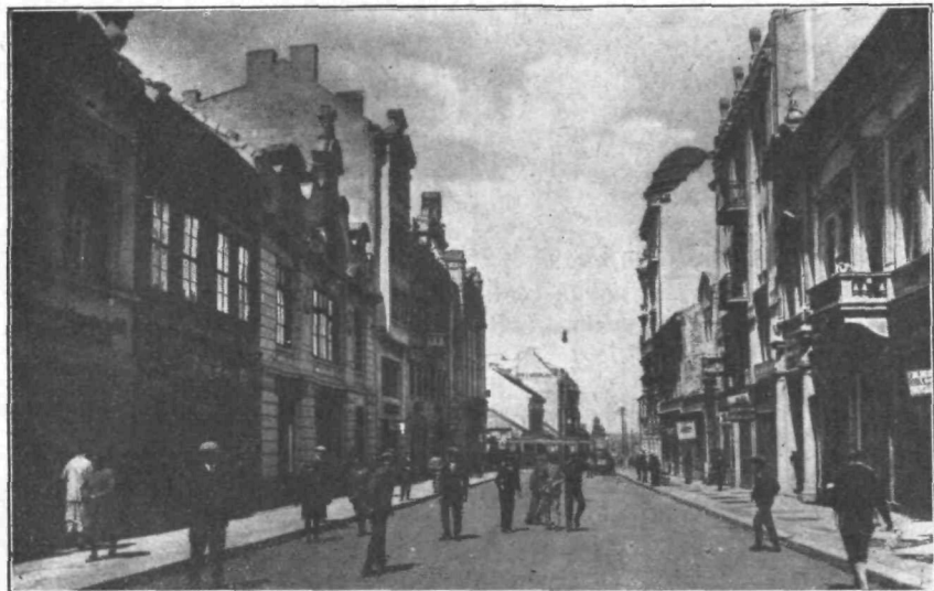
Ulica kralja Petra — pogled z Mihajlove proti Dunavu

umazani in dušljivi ulici, v teh nizkih hišicah je bila stisnjena cvetoča beogradska trgovina polpretekle dobe. Odtod so izšli trgovski razvoj, visoki trgovski ugled in blaginja današnjega Beograda. O vsej tej preteklosti »glavne čaršije« pa nam široka, gladko tlakovana Kralja Petra ulica ne pripoveduje, le redke trgovine in banke v njej nam s svojo starikasto zunanostjo kažejo, da je že dolgo tu njihov sedež.