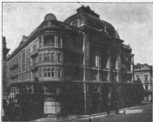
Palača „Akademije nauka“

krase razni kameniti in mavčni kipi. Spodaj so v njej velike trgovine, trgovine so tudi v široki veži pod stekleno streho, ki se visoko zgoraj razpenja nad stavbo, globoko v veži je prostorna kavarna. Široka, odprta stopnišča drže v nadstropja, kjer ima prostore tudi Akademija sama, veliko slavnostno dvorano pa ima poleg drugih prostorov v najemu beogradska borza.