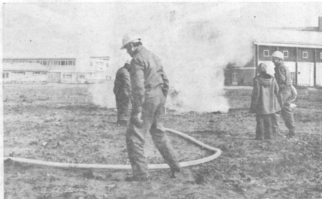
Vaje enot civilne zaščite so priložnost za preverjanje pripravljenosti. Na sliki: prizor z uspele vaje v KS Komandanta Staneta.

Odbor organizacije ZRVS Komandanta Staneta, Ljubljana-Šiška