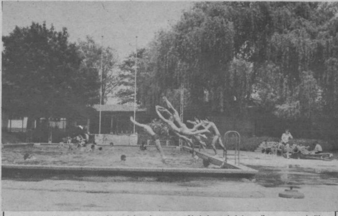
S prvim junijem se začne na Vevčah kopalna sezona. Voda bo v obeh bazenih, cene pa nekoliko višje od lani: ob sobotah in nedeljah (tudi praznikih) bo za starejše 10 dinarjev, za otroke od petega leta naprej 4 dinarje. Med tednom bodo starejši plačali 6 dinarjev, otroci pa 2 dinarja.