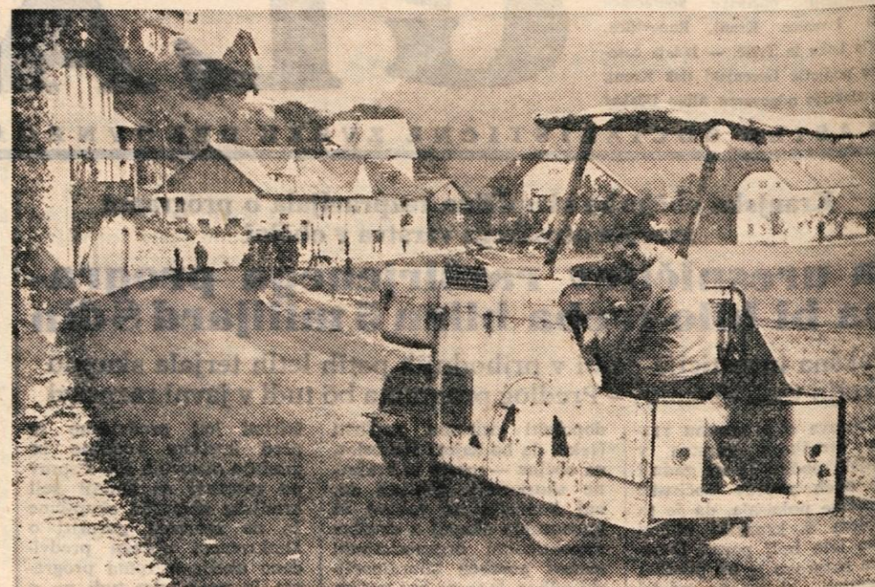
Pogled na sveže asfaltiran del ceste v Poljansko dolino. V ozadju naselje Poljane.

Vse potrebno notranjo opremo in stroje bo Termika nabavila pri firmi Jungers iz Göteborga. Švedski strokovnjaki so že dopotovali na