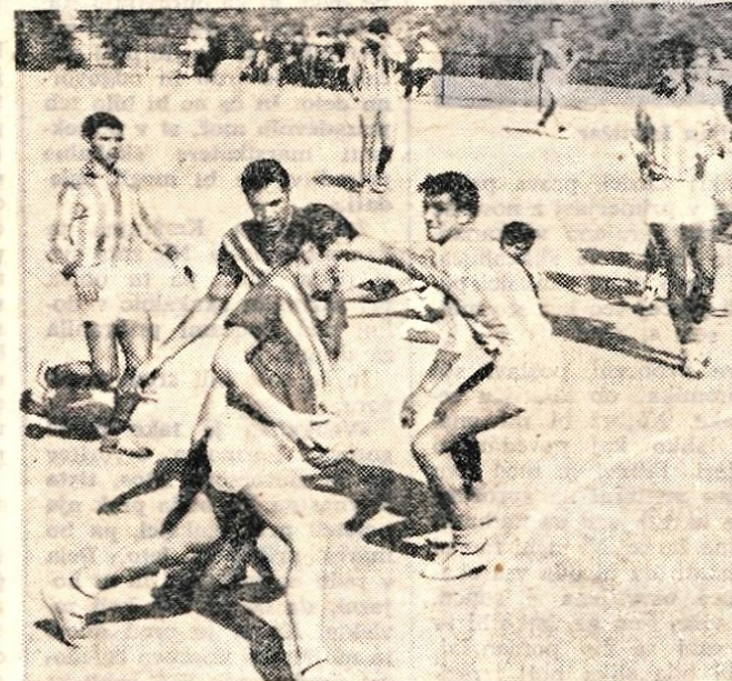
Rokometaši Kranja so v nedeljo po dolgem času spet zaigrali in premagali favorita za prvo mesto ekipo Partizana iz Št. Vida.

V dvorani doma sindikatov v Ljubljani bo v petek, 11. ok- tobra, 16. redna konferenca smučarske zveze Slovenije. Na tem letnem zborovanju bodo smučarski delavci ocenili delo smučarske zveze Slovenije v minulih štirih letih, od katerih je bilo po uspehih vsekakor najbolj uspešno olimpijsko leto, kjer je smučarski šport dosegel doslej najpomembnejše uspe- he v zgodovini smučarskega športa v Jugoslaviji. Smučarska zveza Slovenije je v minulem razdobju posvetila največ pozornosti krepitvi osnovnih smučarskih organizacij, skrbi za dvig strokovnega kadra, mladinskih smučarskih šol ter končno seveda tudi dvig kvalitete smučanja in organizaciji večjih prireditev.