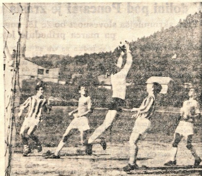
Nogometaši Kranja so uspešno startali v drugi republiški ligi in so v nedeljo doma gladko premagali ljubljanskega Slovana.

Odbojka — V republiški ligi so tokrat nastopili le igralci iz Kamnika. Srečali so se z Mariborom v mestu pod Pohorjem in izgubili gladko z 0:3.