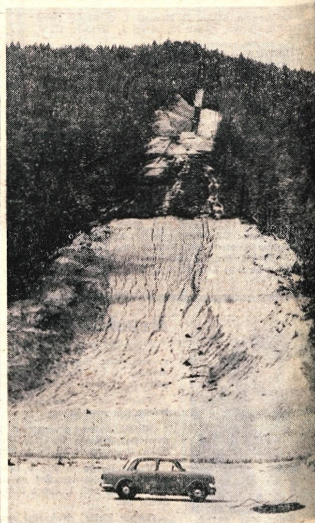
Pogled na planiško velikanko z izteka.