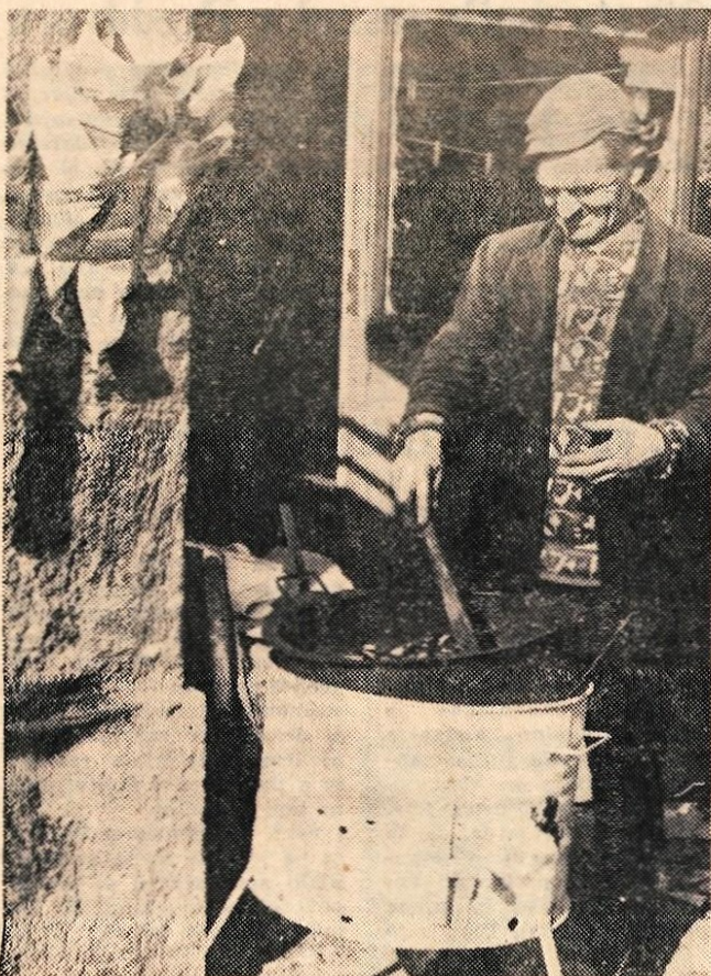
Kranjska jesenska razglednica