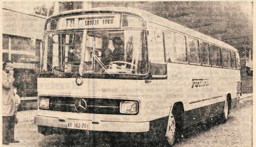
Nov, posebej za lokalne proge konstruiran avtobus, ki vozi na relaciji Škofja Loka—Kranj. Dve takšni vozili je pred 14 dnevi kupilo podjetje Transturist.