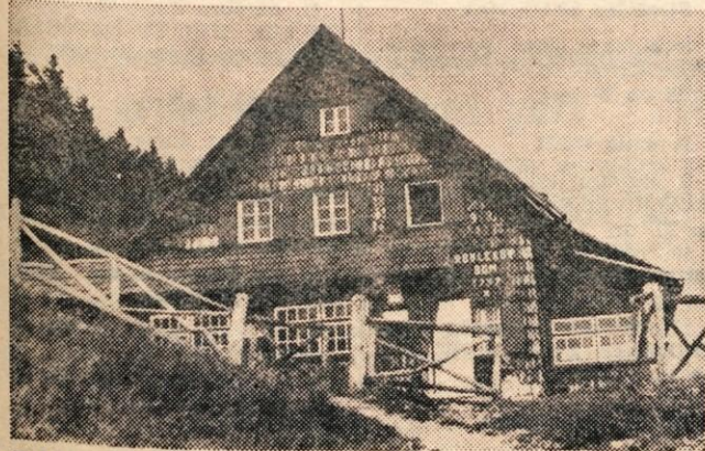
Roblekov dom vzdržuje planinsko društvo Radovljica