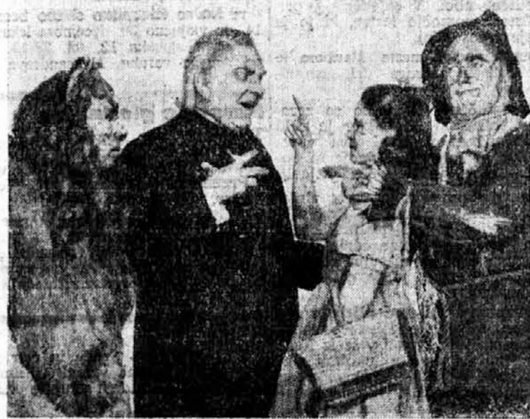
BERR LAHR, FRANK MORGAN, JUDY GARLAND IN RAY BOLGER v MGM FILMU »ČAROVNIK IZ OZA«

zone. Razmeroma zgodaj je pobelil sneg po-