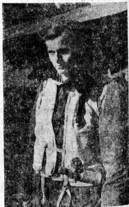
Pilot z nekega nemškega bombnika