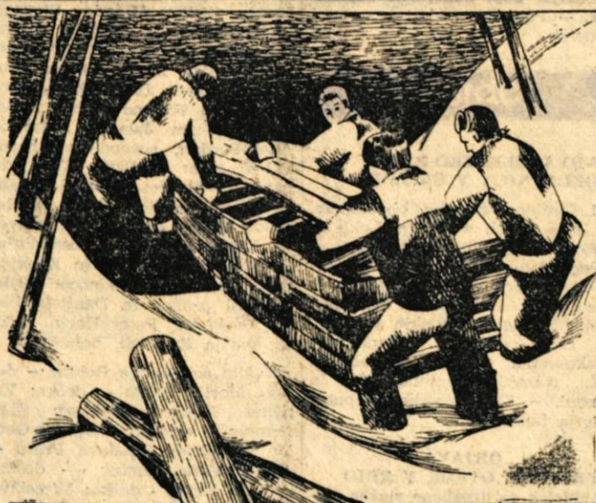
32. Z velikim naporom so ga potiskali možje v gumijastih škornjih proti globlji vodi. Težko so veslali, a vendar so se polagoma oddaljevali od obrežja. Hoteli so dvigniti jadro. Sunek vetra pa jim ga je odnesel in pogal čoln k obrežju. Kriš se je nasmehnil in odšel. Tudi njega je čakala ta stvar.