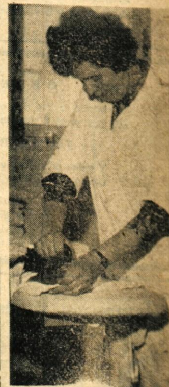
Kjer imajo pralnice tudi likalnice, so stranke tudi bolj zadovoljne.

Podoben problem zaradi prostorov, kot je na Planini, je tudi v pralnici stanovanjske skupnosti Center. Razlika je le v tem, da v pralnici Center lahko tudi