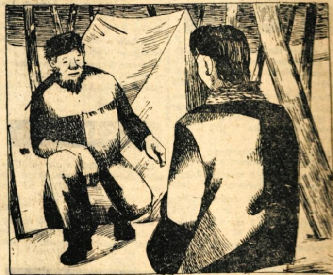
33. Približal se je šotoru. Pri ognju je čepel majhen, debel možakar. »Ti si menda novi nosač,« je rekel. »Jaz sem Jaka Cok.« Od njega je zvedel podatke o njihovih gospodarjih. Thomas Stanley Sprague je bodoči rudniški inženir in sin milijonarja, doktor Adolf Stine pa ima tudi petičnega očeta.