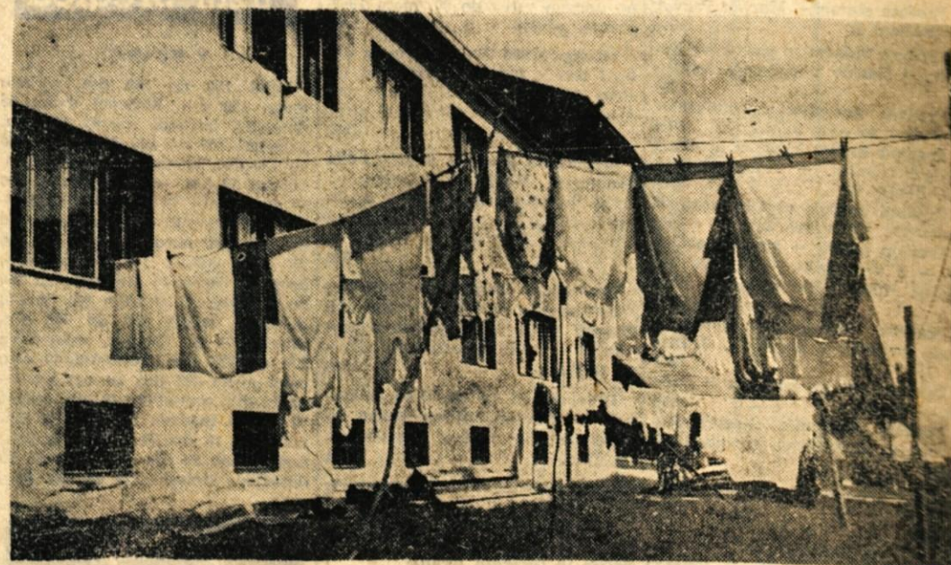
Podobnih slik je v Kranju, pa tudi v drugih mestih in turističnih središčih vsak dan precej. Tako »okrašeni« stanovanjski blok prav gotovo ne dajejo prijetnega videza

»S pralnico je pri nas bolj slabo. Imamo samo en stroj, prositor pa v privatnem poslopu. Štiri dni v tednu je stroj zaseden, vendar pa imamo zaradi pralnice samo izgubo. Delavka, ki je štiri dni v pralnici, dva dneva v tednu pa čisti prostore stanovanjske skupnosti in klub, ima na mesec samo 14.000 dinarjev osebnih dohodkov, pa še teh s pralnico ne moremo ustvariti. Takšne pralnice, kot je naša, verjetno tudi nimajo pomena, saj še perila ne moremo osušiti, kaj šele, da bi lahko tudi likali, čistili in krpali. Pralnica,