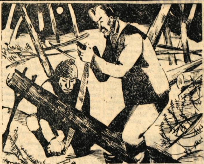
31. Neprenehoma je pihal močan jezerski veter. Videti je bilo, kako so nakladali blago na čolne. To so bile okorne, na hitro zbite škatle, ki so jih zgradile nevesče roke. Deske so dobili na ta način, da so kar na roko razžagali sveže podrtre smreke. Prvi čoln je pravkar odrinil od brega.