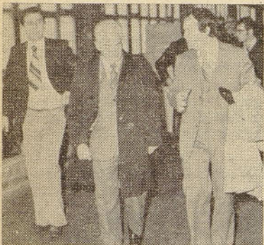
Tov. Hafner v spremstvu pomočnika direktorja za tehnična vprašanja in namestnika predsednika IOK OOS pri ogledu tovarne

Čas tega tovariškega razgovora je vse prehitro minil, ob tako plodni diskusiji, ki se je razvijala (Nadaljevanje na 2. strani)