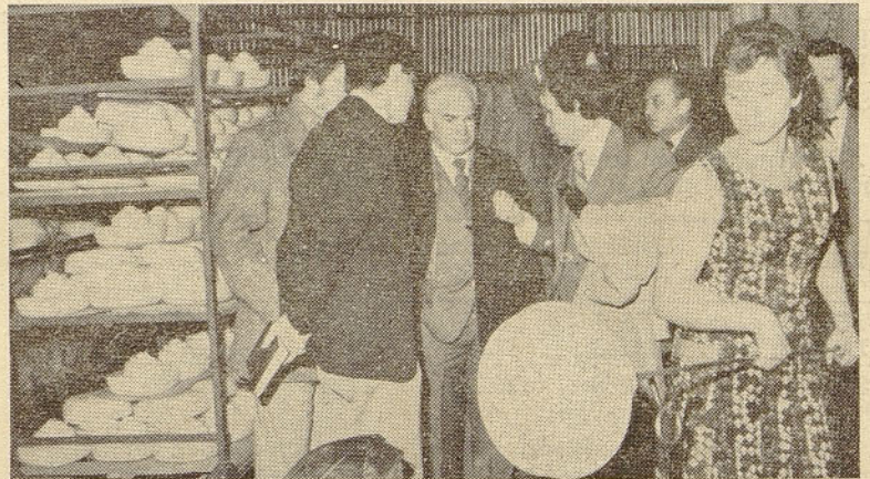
Predsednika ZSS je zanimal proizvodni postopek predelave steklene mase

ma skupnega sestanka predstavnikov sindikata in sekretarjev OO ZK. Ocenjeno je bilo, da je bilo to sodelovanje na ustrezni ravni, posebno v akciji obravnave ključnih računov. Zavedamo se, da imata tako sindikat kot tudi Zveza komunistov iste cilje in tudi dolžnosti za njihovo uresničitev. Napačno pa je vedenje ne-