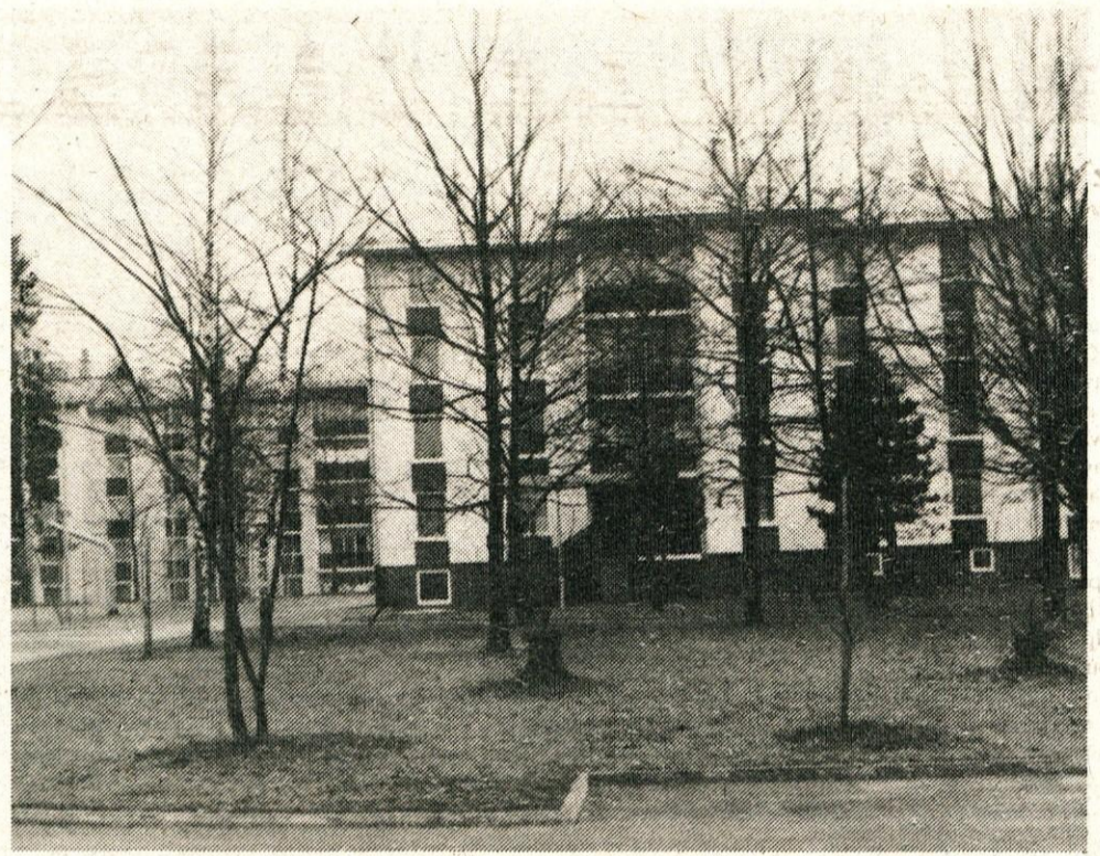
V parku pred kulturnim domom naj bi stal nov spomenik v spomin 48 borcem in aktivistom NOB iz vrst Stolovih delavcev in krajanov Duplice.