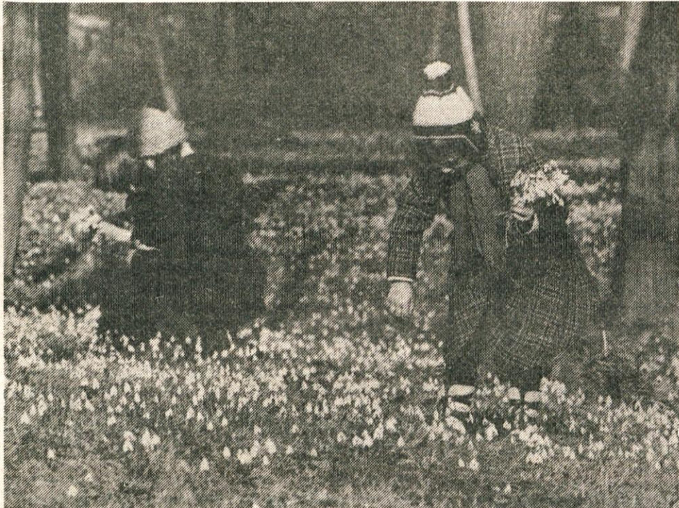
Do prvega pomladnega dne je sicer še skoraj mesec dni, ki nam še lahko prinesejo oster mraz in sneg. A pomlad že nekaj časa naznanja svoj prihod, saj so se na sončnih rebrih razcveteli nežni zvončki, na leskovih cvetovih se že spreletavajo čebele in tudi sonce je v zadnjih dneh nekajkrat prav toplo posijalo.