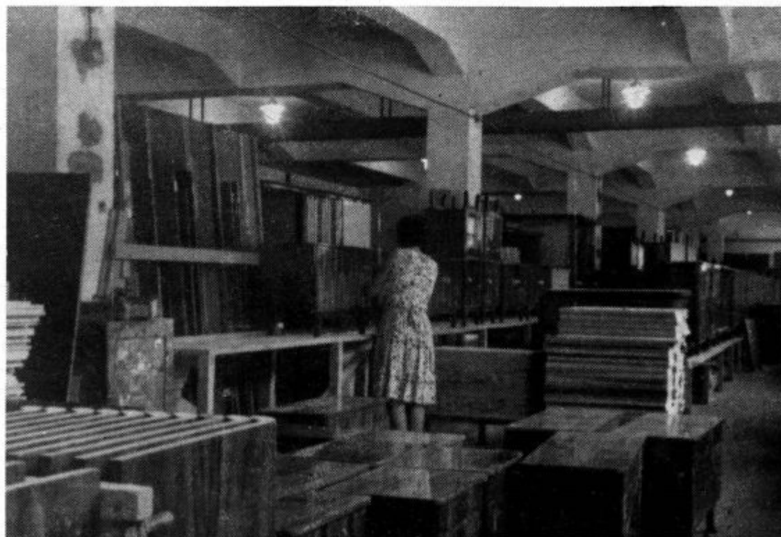
Notranjost Lesne industrije »22. julij«

Ko je končno tudi v Idriji prevladalo mnenje, da mesto ne bo moglo večno živeti od rudnika, je bilo logično, da so se oči gospodarstvenikov uprle v lesno industrijo, čeprav so pri njeni izgradnji zgubili mnogo dragocenega časa. Ker smo historiat njenega razvoja podrobneje že opisali v 1. številu »Idrijskih