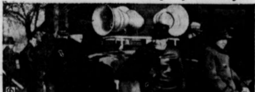
Na sliki so zvočniki UMW na "agitacijskih" avtih, ki jih pošilja v pomoč vsaki uniji, katere so pridružene k C. I. O. Slika gori je bila sneta v Flintu, Mich. v času stavke avtnih delavcev.