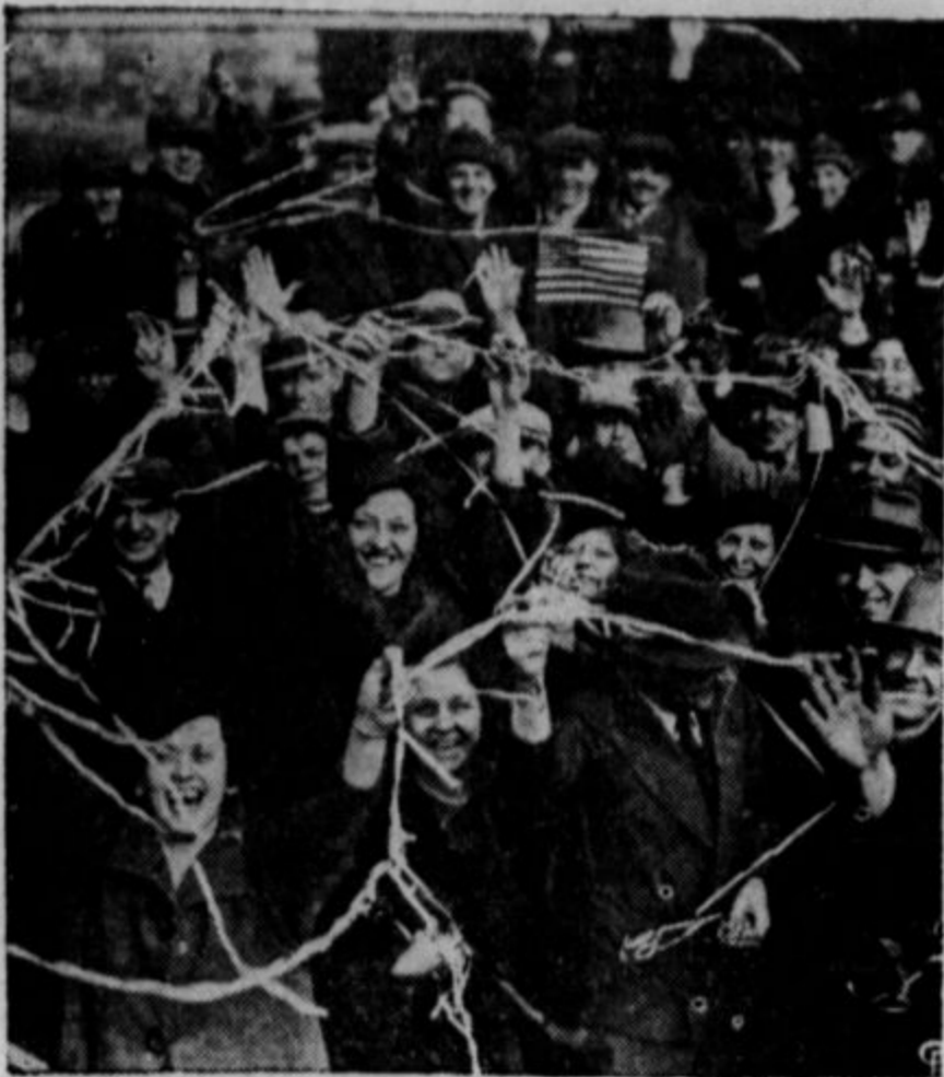
Na gornji sliki so dekleta in moški, uposleni pri Fisher Body kompaniji v Clevelandu, ki so se sporočila, da je stavka poravnana, razveselili toliko, da so priredili javno radovanje. Dasi poravnava ni bila niti z daleč popolna, je unija vendarle ohranila svoj prestiž in nadaljuje z organizatoričnim delom.