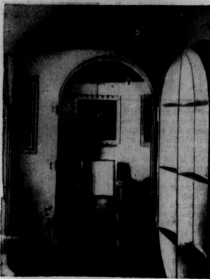
Tudi država divjega pelina—Wyoming—se je "modernizirala". Njena poslanska zbornica je sprejela zakon, ki določa, da se bo obsojence v smrt pokončalo s plinom, namesto z električno, z vrvo ali s puško. Na sliki je ooba v državni jetnišnici, kjer bodo na smrt obsojeni izgubili življenje brez bolečin. Plin jih bo polagoma omamil in zadušil. Edino, kar jim bo prizadevalo muke, bo misel, da so poslani v to celico v smrt. Tak način usmrčevanja je uvedla najprvo — če smo pravilno poučeni — država Nevada. Nji je sledilo še par drugih držav na zapadu, se pred Wyomingom, dočim so države na vzhodu skoro vse nadomestile vislice z električnim stolom.