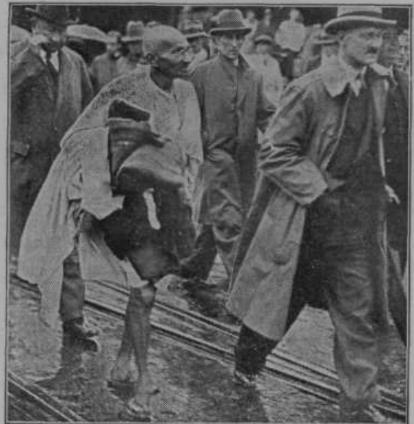
Voditelj indijskega naroda Ghandi se je udeležil posebnega posvetovanja v Londonu, na katerem se je razpravljalo o Indiji kot samostojni državi.

Katakombe, grobovi prvih kristjanov. Večno mesto Rim je še polno skrivnosti, skritih globoko pod zemljo. Italijanska država odkopuje stare spomenike in jih popravlja, sveti Oče pa smatra, da je častna zadeva katoliške cerkve, preiskati zgodovino prvih kristjanov in s tem v zvezi predvsem točno raziskati katakombe. Naša slika nam kaže katakombe, ki so jih pred kratkim odkrili in ki niso, kakor drugi podzemeljski grobovi prvih stoletij po Kr., oropane, ampak so ohranjene docela nepokvarjene.