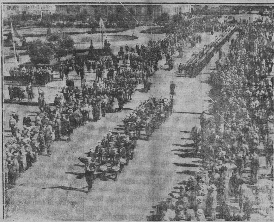
Parada nemških mornarjev po ulicah mesta San Francisco, ko so prispeli v pristanišče s parnikom Karlsruhe in jih je mesto povabilo na obisk. To je bil drugi dogodek take vrste izza časov svetovne vojne.