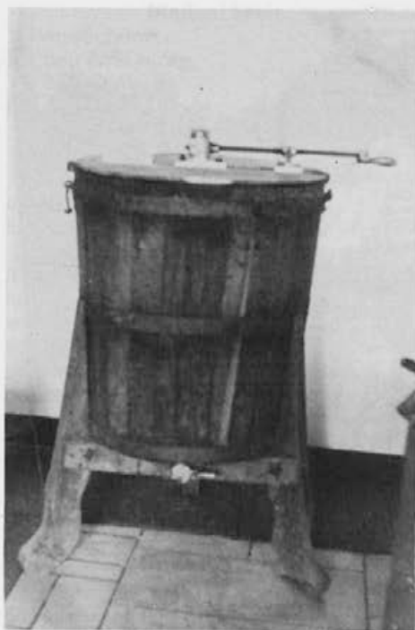
Staro točilo je še danes uporabno