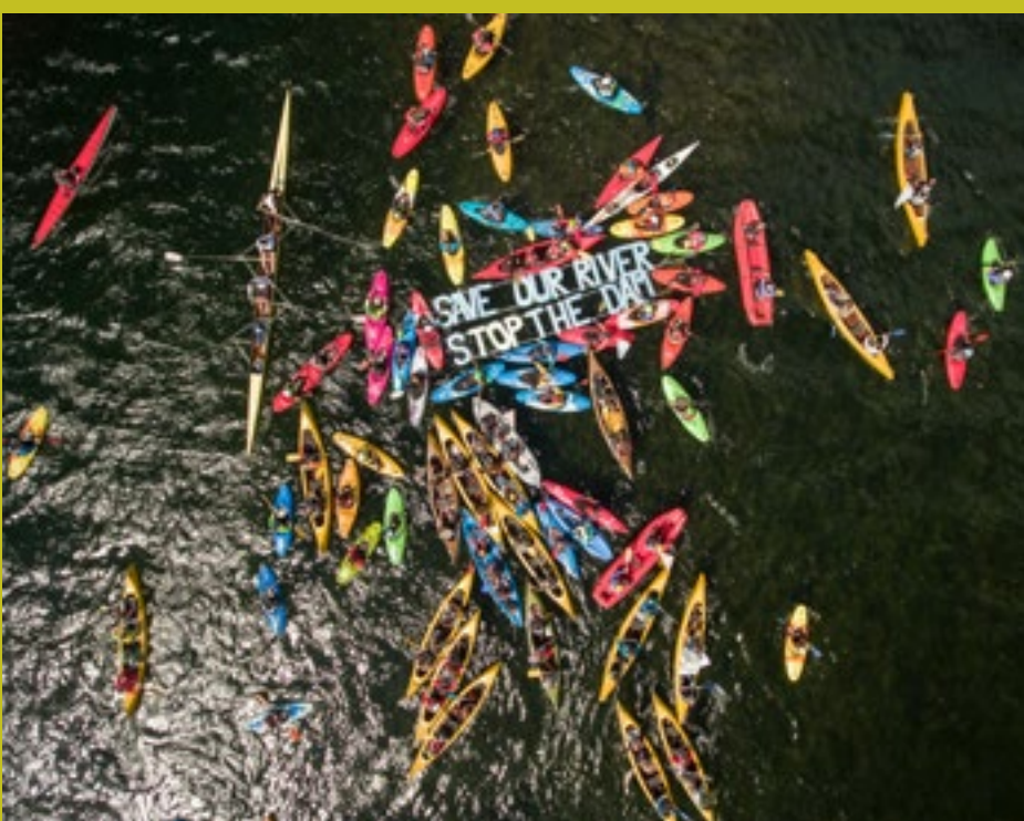
Na Balkanu se še najdejo reke, ki tečejo prosto; treba jih je ohraniti.

obesimo na politiko in na sistem, sami pa ne naredimo ničesar. Čeprav živimo v demokratični državi, še nismo osvojili koraka, ko bi znali stopiti naprej in na glas povedati, da nam nekaj ni všeč, ter potem pokazati boljšo pot in jo zahtevati. Na žalost tudi ne znamo stopiti skupaj. V tujini na primer ljudje aktiviste dobro poznajo in jih tudi finančno podpirajo, saj se zavedajo, da ne gre za sebične ljudi, ki bi delali samo za sebe, temveč aktivistične akcije koristijo celotni skupnosti. V Sloveniji in drugod na Balkanu takšne podpore aktivistom ni. Na žalost nas ljudje še vedno dojemajo kot nekakšne upornike. Ne zavedajo se, da imajo tako oni kot mi vso pravico na glas povedati, da nam nekaj ni všeč, še posebej če je to v korist večine.