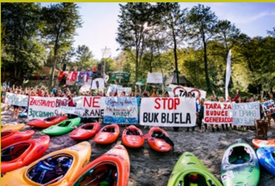
Shod v podporo rekama Tara in Drina brez jezov.

Zasnova bo letos nekoliko drugačna. Odprava ne bo potekala v enem kosu in cel mesec, ampak bo razdeljena v tri enotedenske sklope: po en teden v Romuniji, Sloveniji in Bolgariji. Tako se bomo lažje povezali z domačini in se bolje spoznali. Bolje bomo spoznali regijo in domačinom lažje pomagali z minimalnimi finančnimi sredstvi. Po štirih letih smo razvili ta koncept, ker ocenjujemo, da bo bolj učinkovit tako za nas kot tudi za domačine in za ljudi, ki se nam na poti priključijo.