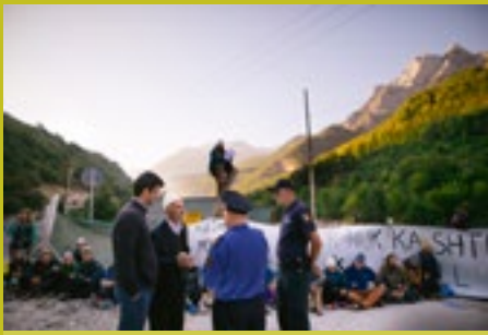
Lokalnim ljudem, predvsem starejšim, je jasno, da zajezitev rek pomeni uničenje njihovih domov.

nalogo ali celo doktorat na temo, ki bo neposredno pomagala eni od rek na Balkanu. Pri tem projekt ne vključuje samo biologov, temveč tudi sociologe, ekonomiste, filozofe in druge profile, ki lahko pripeljejo znanost do nevladnikov. Nevladniki smo namreč kot nek most med znanostjo in običajnimi ljudmi, se pravi, da problematiko zajezitev rek javnosti predstavimo v preprostem jeziku.