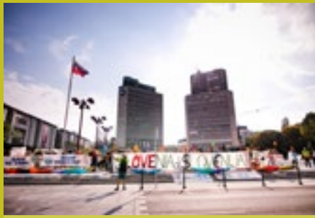
Eden od shodov v Ljubljani za reke brez ovir.

V sklopu drugega tedna Balkan Rivers Tour 4, ki bo potekal v Sloveniji na Soči med 7. in 13. julijem 2019, se bo platforma River Intellectuals predstavila s prvim kampom Students for Rivers Camp, s katerim želimo k Soči privabiti študente iz cele Evrope. V tem tednu se bodo odvijala predavanja in delavnice, predvidena sta tudi dva dneva veslanja na reki, da se bodo lahko študenti na lastne oči prepričali, kaj pomeni turizem, kakšna je divja reka, kaj povzroča prekomerni turizem in kaj pomeni zajezena reka. Pri tem projektu smo že povezani z mnogimi evropskimi univerzami, radi pa bi se še bolj povezali z ljubljansko, predvsem z biotehniško in ekonomsko fakulteto ter s FDV.