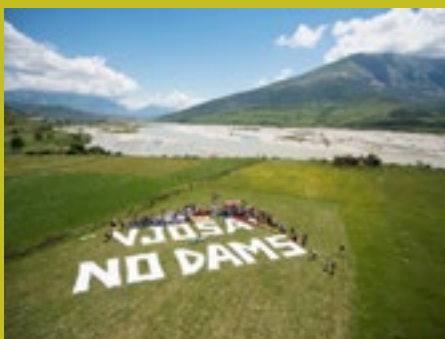
Porečje Vjose je eno od najbolje ohranjenih porečij v Evropi. Fotografija je nastala ob flotilji na finalu prvega Balkan Rivers tour v Albaniji.

ne publicitete umaknila svoje projekte. Nekateri pa so nam začeli tudi groziti.