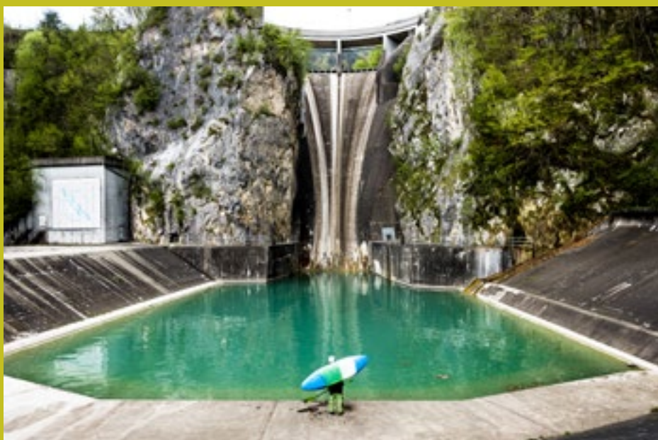
Z zaježitvijo reke se prekine njen tok. Ko se prekine tok, se prekine tudi življenje v reki. Na sliki jez hidroelektrarne Moste na Savi Dolinki, najvišji in najstarejši jez v Sloveniji.

bom študiral. Moj odgovor, da se bom najverjetneje vpisal na Fakulteto za šport, jo je šokiral, kar mi je dalo vedeti, da s tem točnem mimo. Označila me je za karierista. Doma sem potem veliko razmišljal o najinem pogovoru in prišel do spoznanja, da ima še kako prav. Želel sem študirati biologijo, a ker srednja ekonomska šola nima predmeta iz biologije, sem bil v težavah. V zadnjem letniku sem se zato želel prepisati, vendar mi je ravnatelj nazadnje omogočil, da sem lahko opravljal maturo iz biologije na kranjski gimnaziji in se nato vpisal na študij biologije.