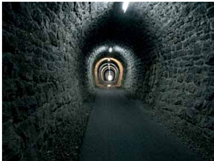
Tunel v Izoli.