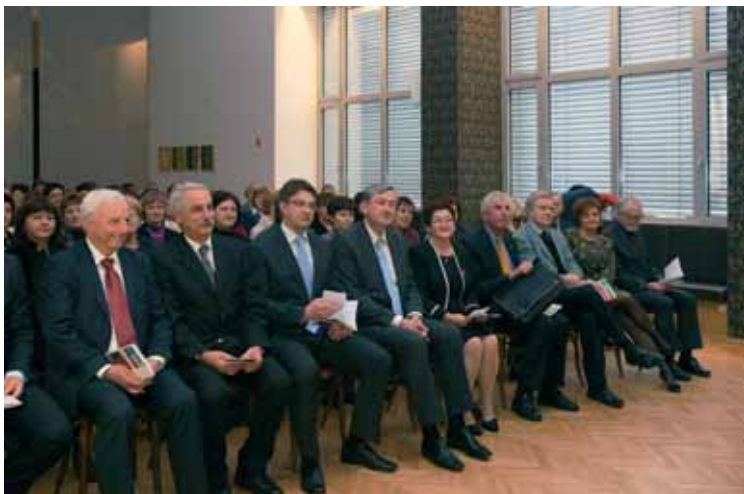
Prireditve so se udeležili visoki gostje

Tudi zaradi prepoznavnosti Taluma na slovenskem kadrovskem področju smo dobili priložnost, da 30. obletnico slovenskega kadrovskega združenja organiziramo v Talumu. Častni govornik je bil predsednik države dr. Danilo Türk. Njegove besede, ki jih lahko preberete na njegovi spletni strani ali na spletni strani Slovenske kadrovske zveze, potrjujejo nujnost strokovnega dela na kadrovskem področju tudi v prihodnje. To v Talumu delamo že desetletja. ▣