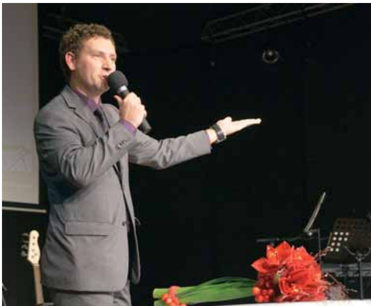
... ko mu je na roko priletel metulj ...

kovanju povezovalnega programa dali relativno proste roke. Na govor se dobro pripravi, čeprav med nastopom poskuša delovati tudi impulzivno in spontano. Povezovalni tekst pa vedno zajema tekočo problematiko. Če je končni izdelek všeč njemu, po-