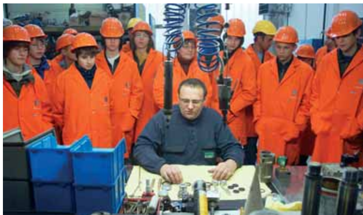
V hidravlični delavnici

V soboto, 3. decembra 2011, smo tako v Talumu prvič organizirali