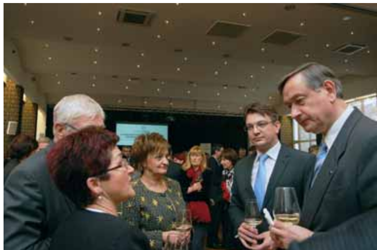
Po uradnem delu prireditve