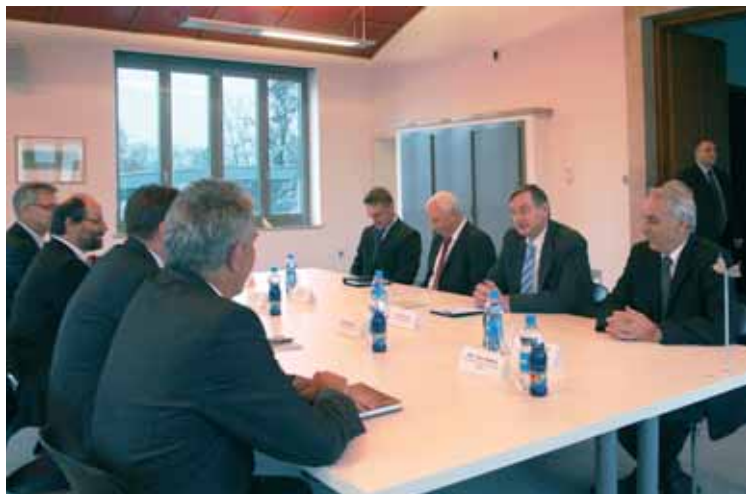
Člani Uprave Taluma v razgovoru s predsednikom dr. Danilom Türkom