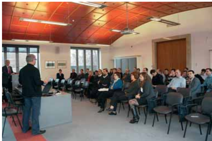
Predstavitel Taluma udeležencem srečanja

Trenutno potekajo programi raziskav in razvoja novih materialov in tehnologij v posameznih poslovnih enotah, tako kot smo predvideli v prijavi na razpis za evropska sredstva. To seveda ni edini smisel razvojnega centra. Prej ali slej se bodo poslovne enote začele povezovati med seboj in sodelovati pri skupnih razvojnih projektih. S tem bomo dosegli večjo izkoriščenost raziskovalcev, izmenjavo različnih znanj in izkušenj ter ne nazadnje boljše izkoriščenost raziskovalne opreme. V družbi smo prepričani, da bo razvojni center omogočil boljše, hitrejšo in tudi cenejšo izvedbo razvojnih projektov, kar bo v končni fazi pomenilo, da bodo družbeniki razvojnega centra postali na svojih trgih bolj konkurenčni. ▣