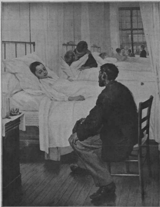
V otroški bolnici.

licu. Ljudje so se mu odmikali radovoljno. Negotovih korakov je taval Kofetič skozi množico in je še vedno krilil z rokami. Pregibal je usta, kakor bi hotel govoriti. Toda ljudje so čuli samo nerazločen šepet. Že