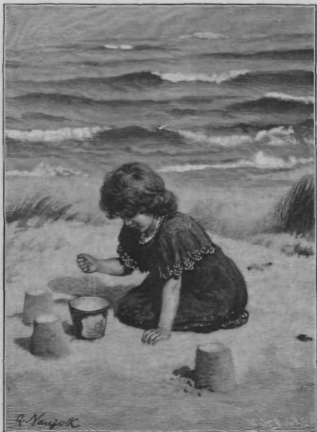
Lenčica zopet srečna . . .