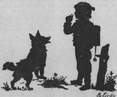
Ožbalt na poti v šolo.

S solzami v očeh ponovi Lenčica na učiteljičin poziv zatožbo. Ožbalt je še vedno gledal v tla ter nekaj momljal in mencial v klopi . . .